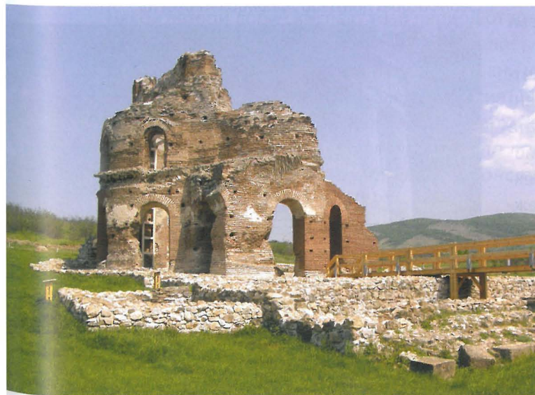
Ил. 2. Червената църква, край гр. Перущица, © ludetini2.blogspot.com

в нейната история и се явяват като мерило за развитието на настоящата култура спрямо тази на предшествалите я обитатели. Така у хората постепенно се изгражда и налага едно определено отношение на уважение, а понякога и на страхопочитание, към останките от миналото. С течение на годините и вековете това отношение допълнително се засилва и затвърдява, благодарение на дистанцията във времето между съвременниците и древните създатели. (ил. 2) „Съвременният наблюдател на старинни паметници получава естетическо удовлетворение не от степента на запазе-