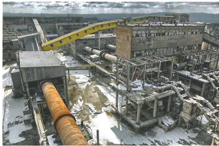
Ил. 1. „Kremikovci“, кв. Кремиковци, гр. София © George Palov

От най-дълбока древност хората откриват останки и проявления от по-стари култури, които са съществували на дадено място преди тях. Руините винаги съпътстват човешката цивилизация