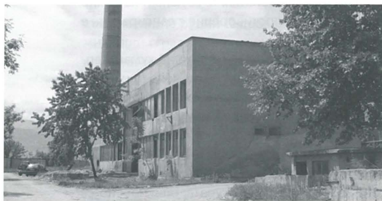
Ил. 10. Бивше котелно – съществуващо положение ©Климент Иванов Архитекти

и приложна дейност и за разлика от другите науки е в състояние не само да изучава останките от миналото, но и да упражнява реално въздействие върху тях. Това въздействие се изразява в прилагане на архитектурни средства за намеса, които са насочени към придаване на нова функция на руинираните обекти с цел тяхното повторно оживяване и социализиране. Благодарение на тези мерки руините могат да бъдат опазени от естествено или нарочно унищожаване, което неминуемо би ги очаквало в бъдеще, и съхранени за поколенията. Поради това, че много от тях са разположени в съществуваща градска среда, със свои характерни излъчване и атмосфера, опазването на тези сгради и комплекси като резултат би довело до запазване и на тази среда и съхраняването на специфичното усещане за място и принадлежност. По-долу се представя един пример на промяна на функцията на бивша индустриална сграда в кв. „Кючук Париж“, гр. Пловдив – котелно на завод е адаптирано в съвременна сграда за рекламна агенция и печатница. Проектант – Климент Иванов Архитекти [16]. (ил. 10, 11)