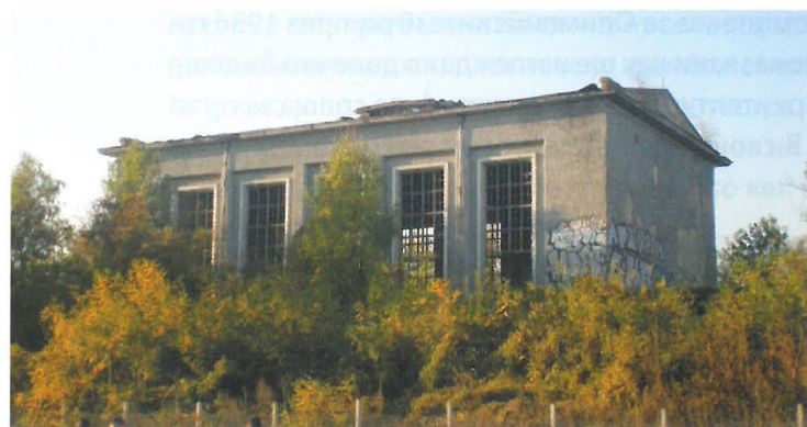
Ил. 5. Бивше котелно, кв. „Дианабад“, гр. София