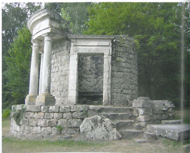
Ил. 3. Храмът на модерната философия, парк „Jean-Jacques Rousseau“, Франция

През 1934 година архитектът на Адолф Хитлер – Алберт Шпеер, публикува своята „Теория за ценността на руините“ ( Die Ruinenwerttheorie ). Основната концепция в нея е, че представителните сгради трябва бъдат респектиращи, монументални и да са проектирани по такъв начин, че да продължават да изглеждат внушително дори и след като се превърнат в руини. Монументалната архитектура е била възприемана като „единственият подходящ архитектурен образ на една вечна империя“ и е била считана за „политическо оръжие и построена пропаганда“ [6]. Теорията е предложена като стратегия за работата по знакови сгради в град Берлин, замислен като бъдеща