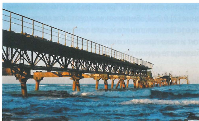
Ил. 6. „Abandoned“, България

съвременните руини се добавят и едромащабни търговски сгради (молове); големи многофамилни жилищни сгради в силно урбанизирани райони; както и остатъците от строителния бум и развлекателната индустрия по курортите (ил. 7). Всички те представляват архитектурни, инженерни или урбанистични обекти, които са загубили своята първоначална функция или тя вече е станала неактуална. Поради тази причина са изоставени и се намират в различна степен на упадък и разрушаване. Тук трябва да се разгледа и една особено характерна група от представители на съвременните руини – недовършените сгради (ил. 8). Тези обекти всъщност не се превръщат в руини след период на разцвет и упадък, а се пренасят директно до следващото състояние – това на руини, още преди да бъдат построени. Р. Смитсън в своите есета ги нарича „преобърнати руини“ ( ruins in reverse ) [14].