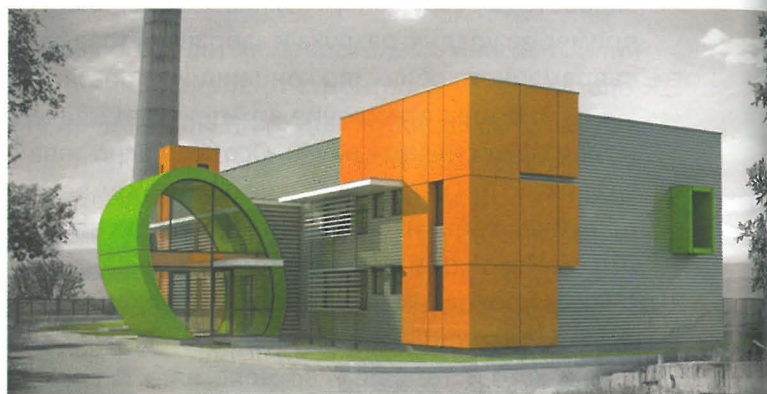
Ил. 11. Бивше котелно – нов проект ©Климент Иванов Архитекти

Тази статия цели да осветли и посочи съвременните руини като изключително подходящи обекти за архитектурна работа. При тях архитектурната намеса е не само възможна и позволена, но дори е желателна и необходима за тяхното бъдещо съхраняване и социализиране. Най-важното е, че е възможно тези обекти да бъдат опазени с чисто архитектурни средства, без да се налага намеса на държавни инстанции, специализирани институции или нормативни актове. Освен това, не трябва да се забравя, че значителна част от тях са разположени в непосредствена близост до архитектите, в близките околности и дори в регулационните граници на градовете, в които живеем и работим. А това е буквално пред очите и моливите ни.