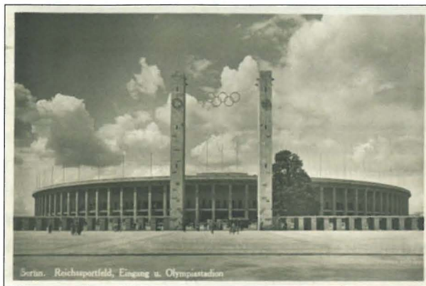
Ил. 4. Олимпийски стадион, гр. Берлин – 1936 г.

Съвременните руини обхващат богата гама от типове обекти, която непрекъснато се допълва от нови представители. Традиционно това са бивши индустриални обекти от периода на промишления бум, който включва отделни здания (ил. 5) или заводски комплекси (ил. 1), а в Русия – и цели градове. Към тях също се добавят и военни инсталации и останки от Студената война; сгради – символи на бивши тоталитарни режими; изоставени селища в провинциални райони; бивши индустриални крайградски територии; неизползваеми железопътни и други транспортни съоръжения (ил. 6); и дори останки, свързани с мореплаването [13]. В по-ново време към групата на