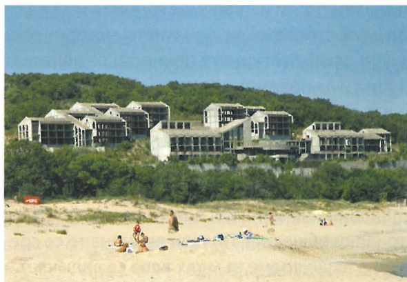
Ил. 7. „Творчески екологичен комплекс“, местност Аркутино ©Климент Иванов

съвременните руини се добавят и едромащабни търговски сгради (молове); големи многофамилни жилищни сгради в силно урбанизирани райони; както и остатъците от строителния бум и развлекателната индустрия по курортите (ил. 7). Всички те представляват архитектурни, инженерни или урбанистични обекти, които са загубили своята първоначална функция или тя вече е станала неактуална. Поради тази причина са изоставени и се намират в различна степен на упадък и разрушаване. Тук трябва да се разгледа и една особено характерна група от представители на съвременните руини – недовършените сгради (ил. 8). Тези обекти всъщност не се превръщат в руини след период на разцвет и упадък, а се пренасят директно до следващото състояние – това на руини, още преди да бъдат построени. Р. Смитсън в своите есета ги нарича „преобърнати руини“ ( ruins in reverse ) [14].