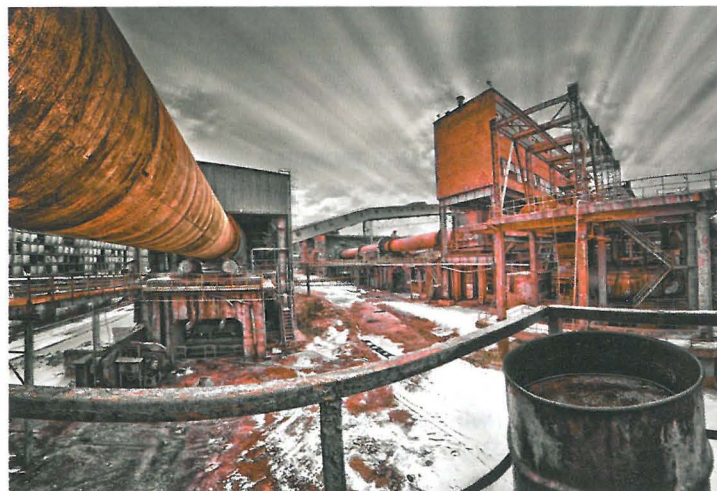
Ил. 9. „History in red“, кв. Кремиковци, гр. София

При съвременните руини обаче този проблем практически не съществува, тъй като те обикновено не са обект на интерес нито на обществеността, нито на институциите, а въпросът за тяхната евентуална културна ценност тепърва предстои да бъде поставен на дневен ред за разглеждане и анализ. Всъщност всякакъв вид внимание, проявено към тях, би им бил по-скоро от полза, отколкото във вреда. Така съвременните руини предлагат обилен архитектурен материал едновременно за изследователска и за проектантска работа. Той е впечатляващо богат и като количество, и като потенциална ценност на обектите, от които е съставен. В бъдеще се очаква архитектурната наука да разкрие и разработи този потенциал, като го включи в палитрата от обекти, привични за предмет на нейната дейност. Освен това, архитектурата се намира в уникална позиция спрямо останалите науки, които се занимават с тази тема. Поради своя специфичен характер тя съчетава в себе си научна