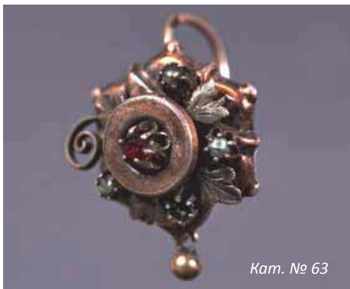
Кам. № 63

Изложба от фондовете на РИМ Сливен в Музея на НБУ