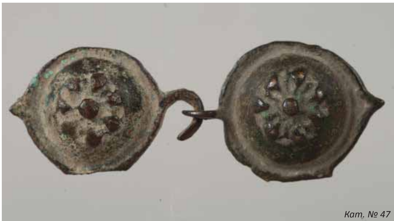
Кат. № 47