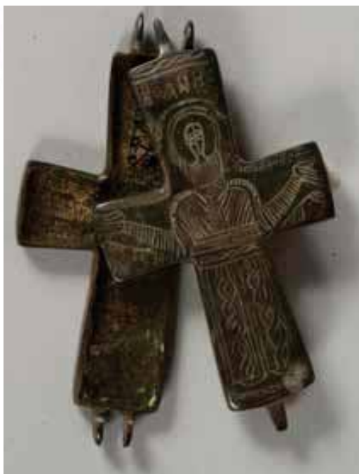
Кат. № 43