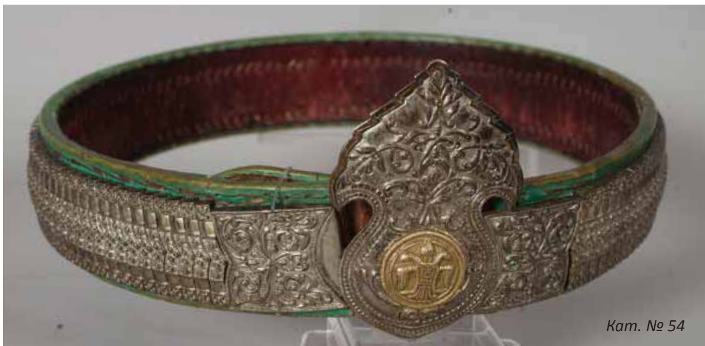
Кат. № 54