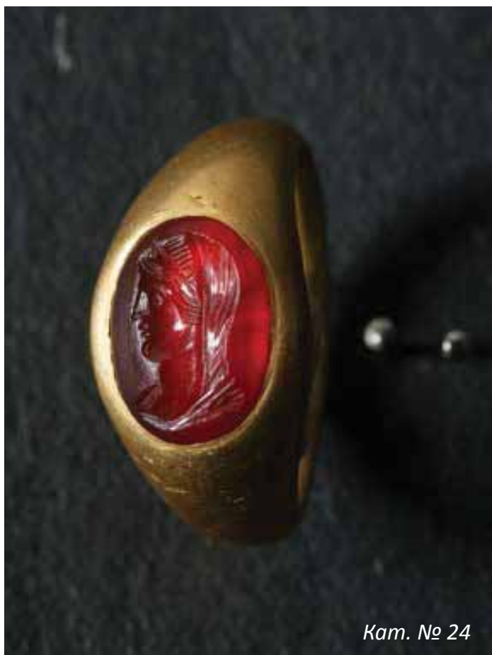
Кат. № 24