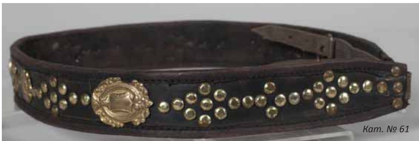
Кат. № 61