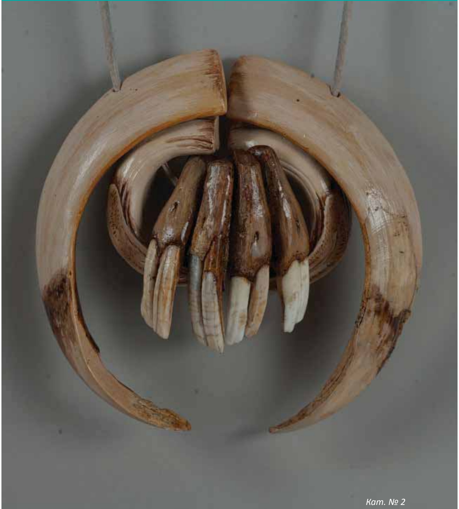
Kam. № 2