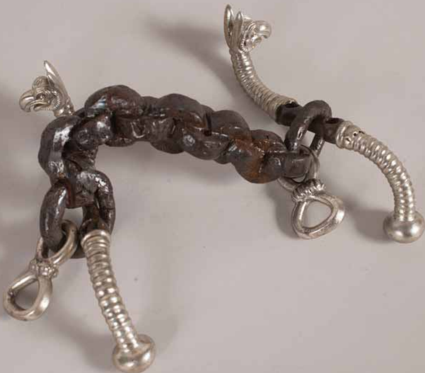
Кат. № 10

Юзда, сребро, желязо, 4в. пр. Хр. Далакова могила, с. Тополчане