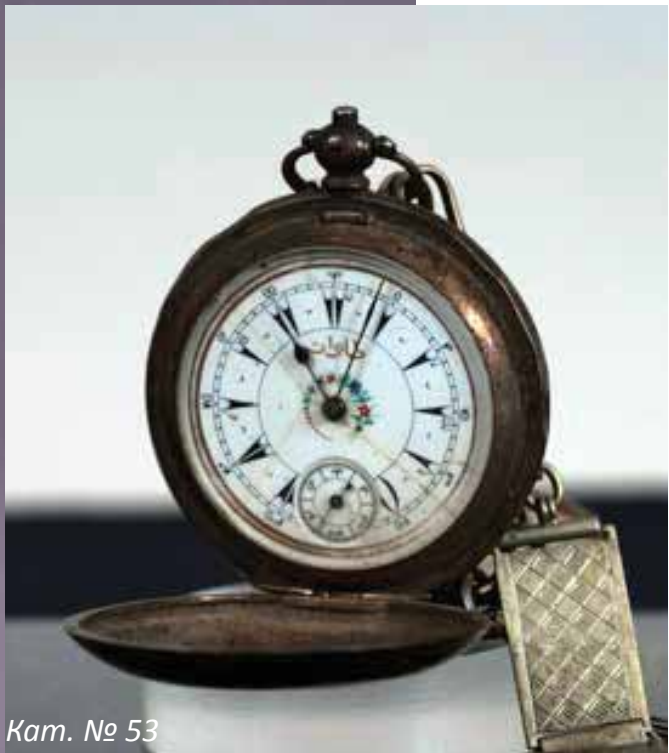
Кам. № 53