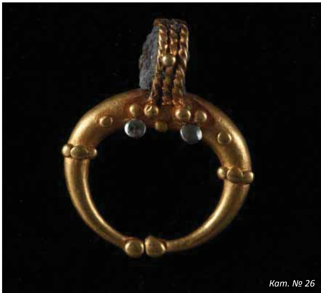
Кат. № 26

Златният пръстен е изработен от отлята златна халка с касета за прикрепване на камък. Върху полускъпоценния камък е гравирани бюст на жена в профил надясно. Изображението дава представа за модата при жените през 2-3 в. по нашите земи.