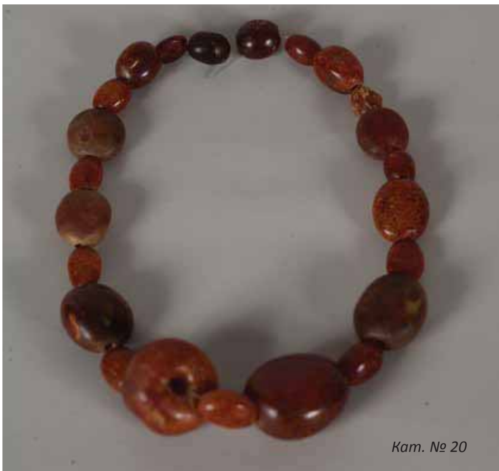
Кат. № 20

Изложба от фондовете на РИМ Сливен в Музея на НБУ