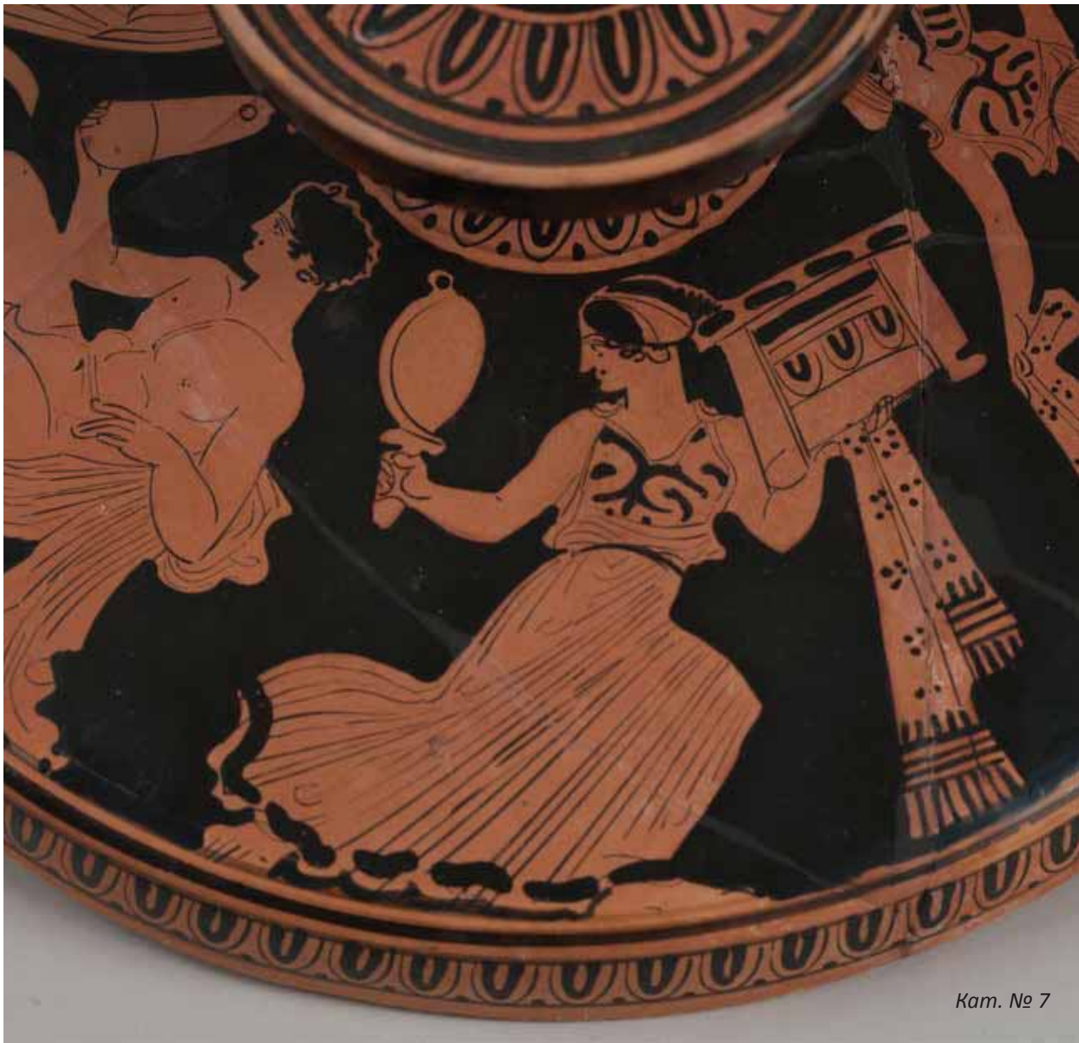
Кат. № 7

Лекане от 4 в. пр. Хр., Тракия, Далакова могила с брачна сцена върху капака.