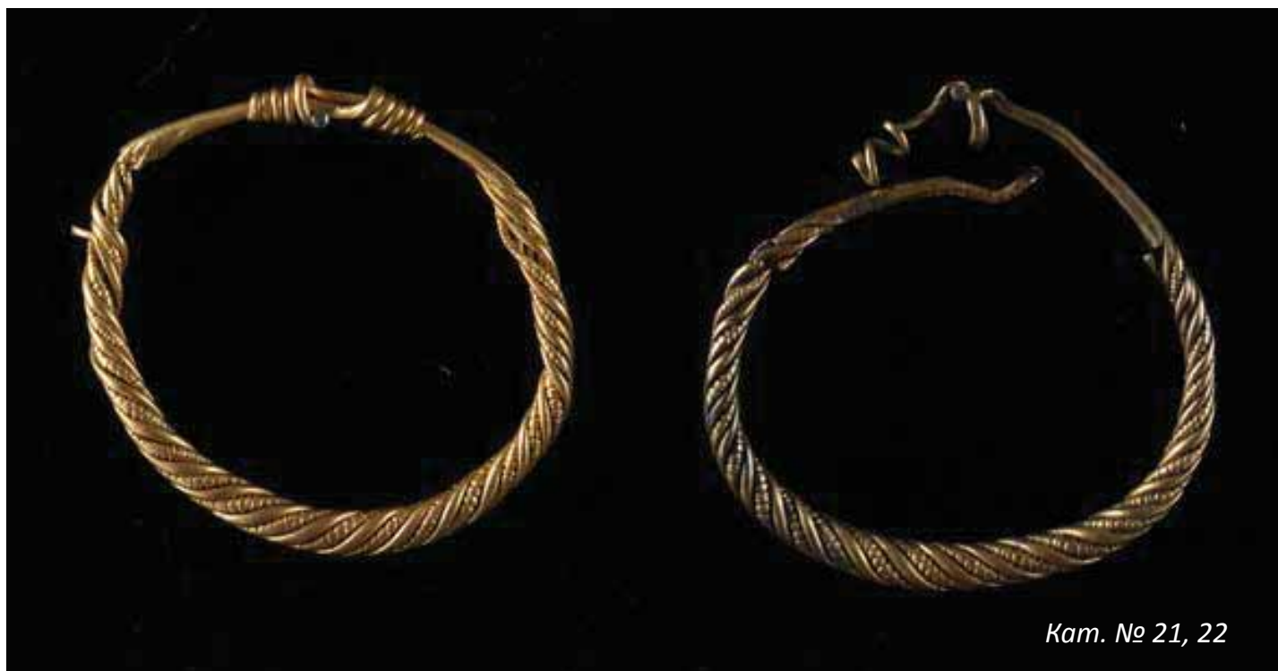
Кат. № 21, 22