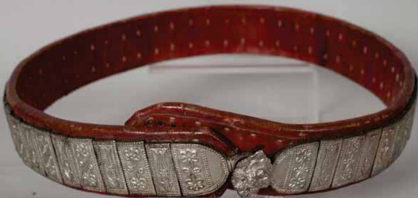
Кат. № 55

С навлизането на стоково-паричните отношения и евтините промишлени бижута, произведени на запад, местните ръчно изработени изделия стават нерентабилни, неефикасни и прекомерно скъпи. Всички тези причини провокират местните майстори да се съобразяват с този факт, да видоизменят и опростяват своите продукти, като едновременно с това се отдалечават от основните принципи на златарското изкуство. Бавно и постепенно високо художествените произведения на този занаят от епохата на Възраждането отстъпват място на безличните и унифицирани вносни образци и от еснаф със собствена емблема, утвърден авторитет и богати традиции, той се превръща в едва кретащ, със силно стеснени професионални и творчески цели.