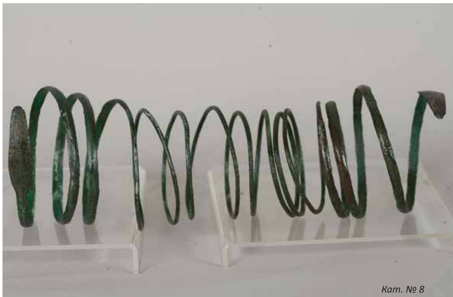
Кам. № 8