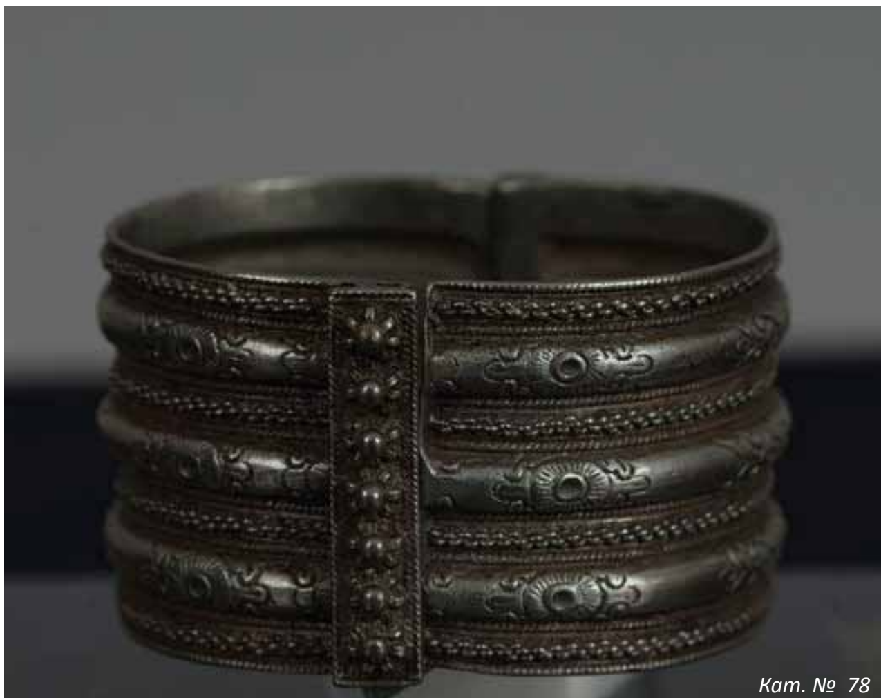
Кат. № 78

Изложба от фондовете на РИМ Сливен в Музея на НБУ