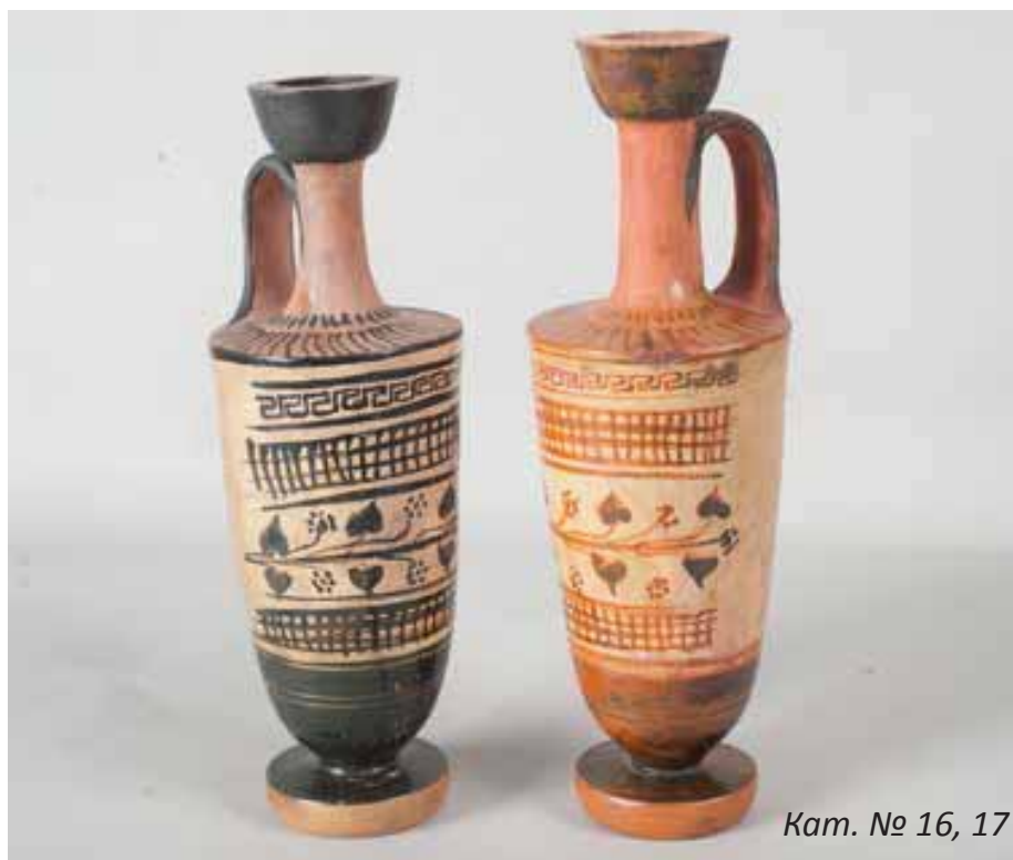
Кам. № 16, 17