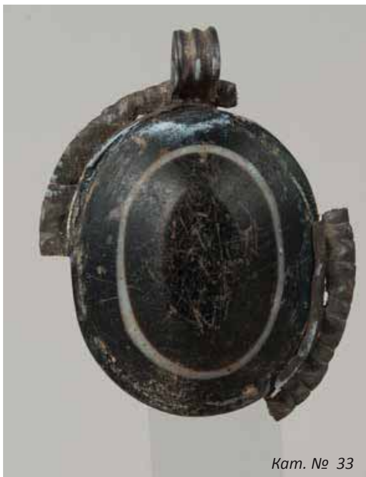
Кат. № 33