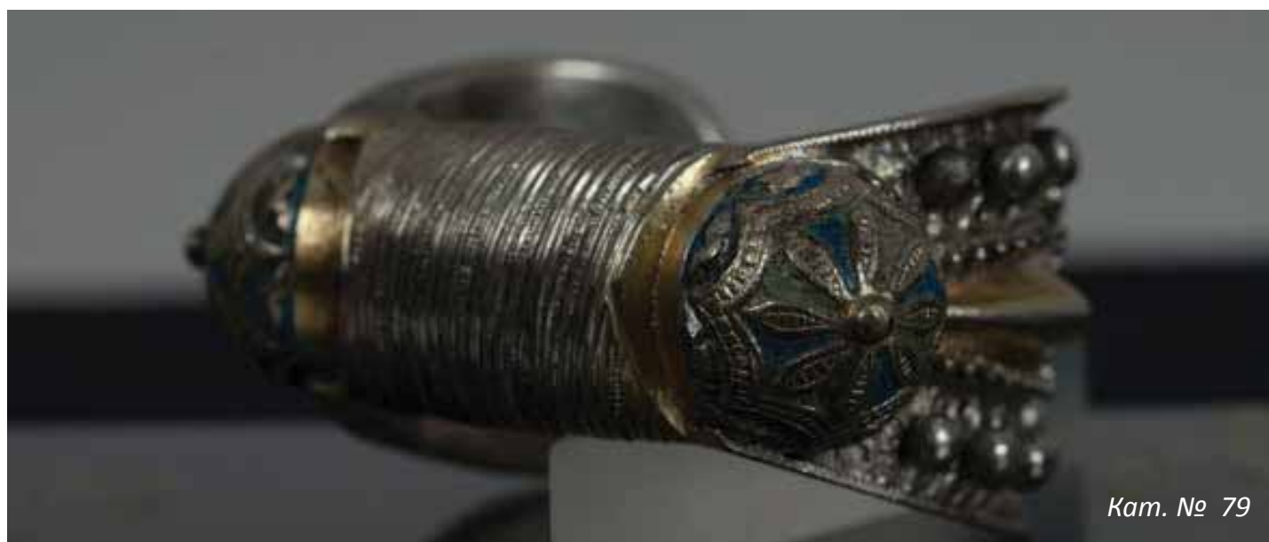
Кат. № 79

При гривните има много голямо разнообразие както между отделните видове, така също и като вариации на един и същи модел. Най-често срещаният образец са гривните, изчукани с калем, в две еднакви половинки, които се затварят с шарнир. Има ги в най-различни ширини с едно, две или три изпъкнали хоризонтални полета, с гравирани геометрични фигури – ромбове, триъгълници, зигзаговидни