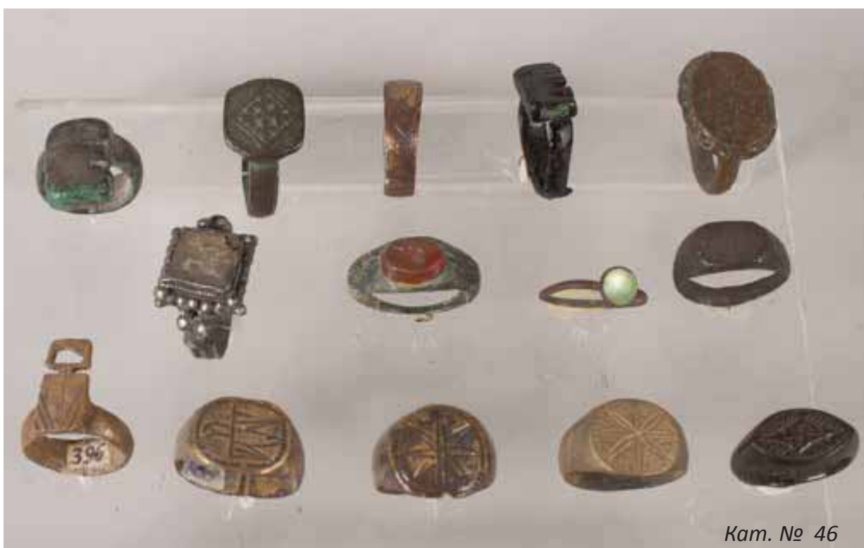
Кат. № 46