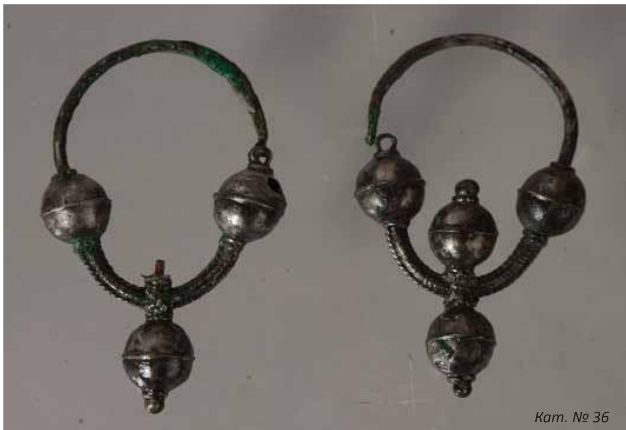
Кат. № 36