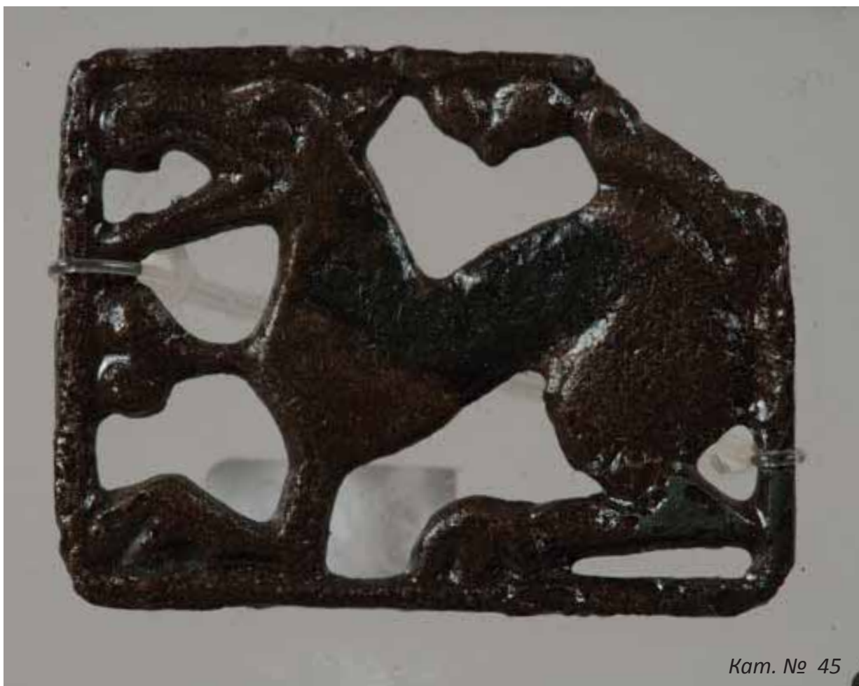
Кат. № 45

Изложба от фондовете на РИМ Сливен в Музея на НБУ