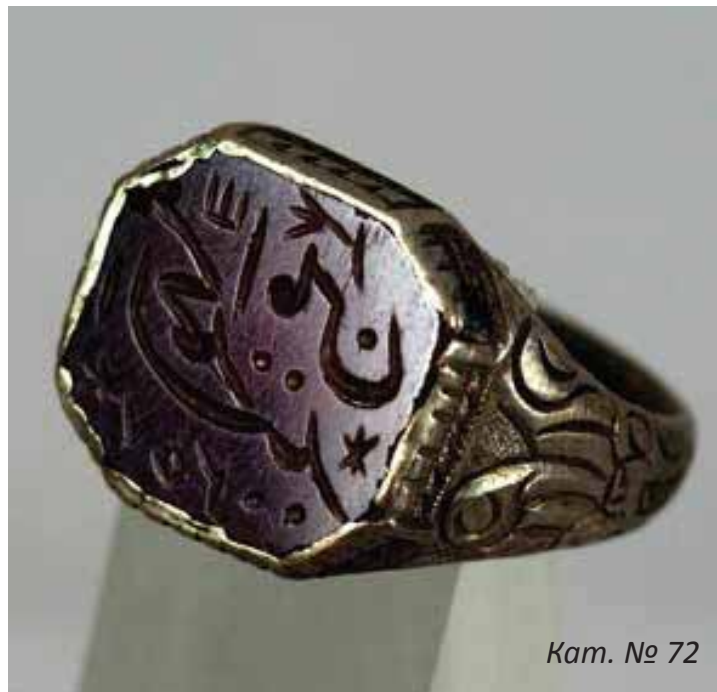
Кат. № 72