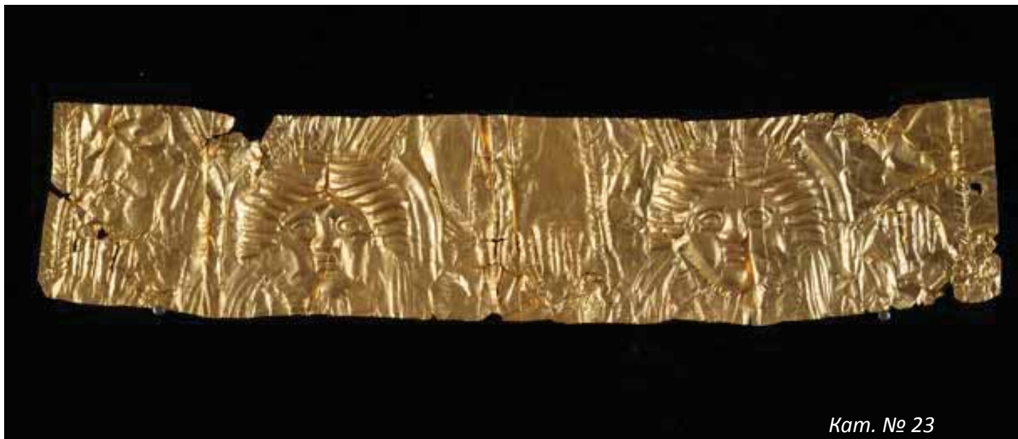
Кат. № 23