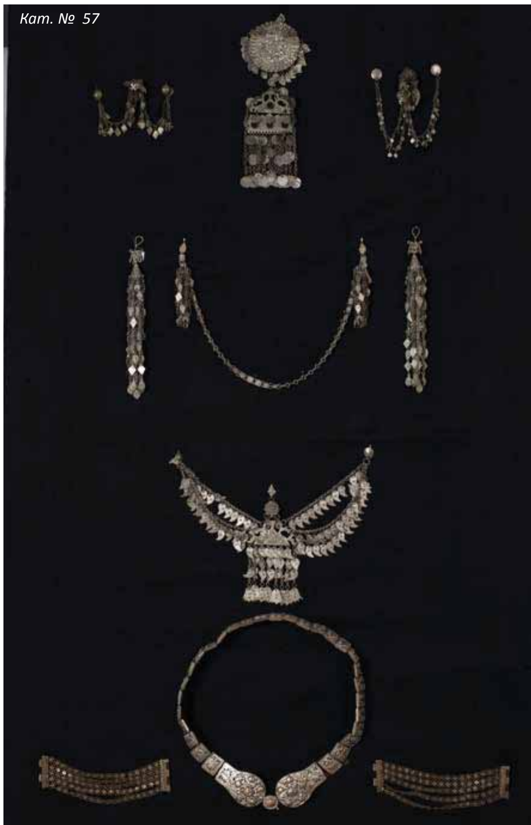
Комплект накити от сребърна сплав за женски костюм