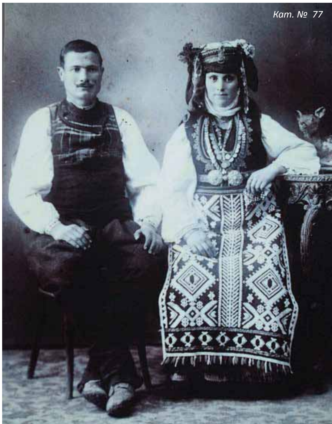
Снимка на традиционни носии с накити от Сливенско, 19 век

Старите техники на обработка на благородните метали – отливане и коване, познати още от средновековието, са усъвършенствани и доразвити. Особено силен тласък получава изчукването, чрез майсторското изпълнение на което се получават най-различни видове релеф – нисък, плосък, висок, миниатюрен. Обикновено накитите се отливат