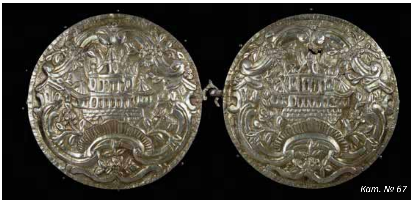
Кам. № 67