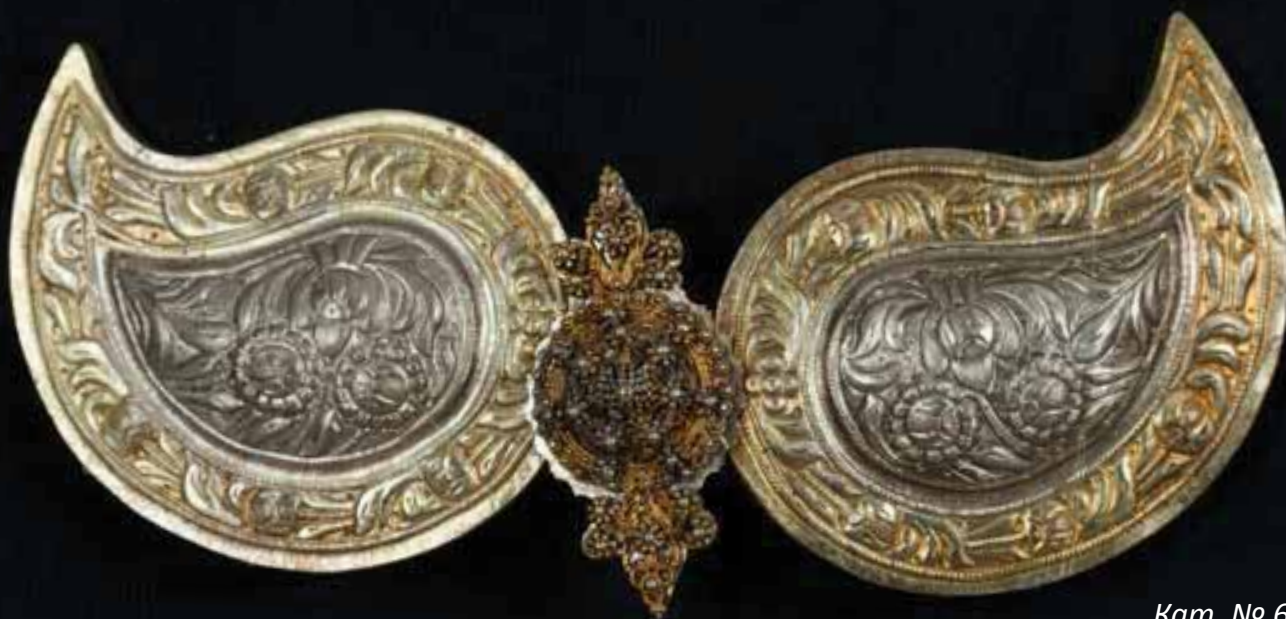
Кат. № 69