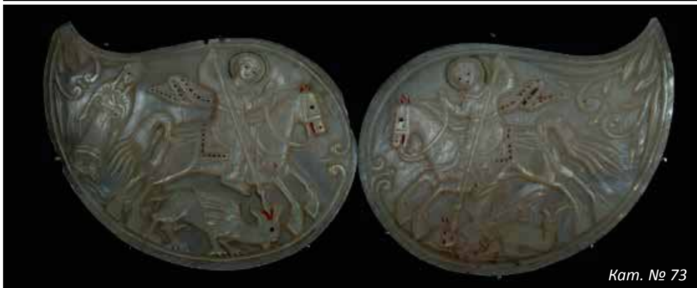
Кам. № 73