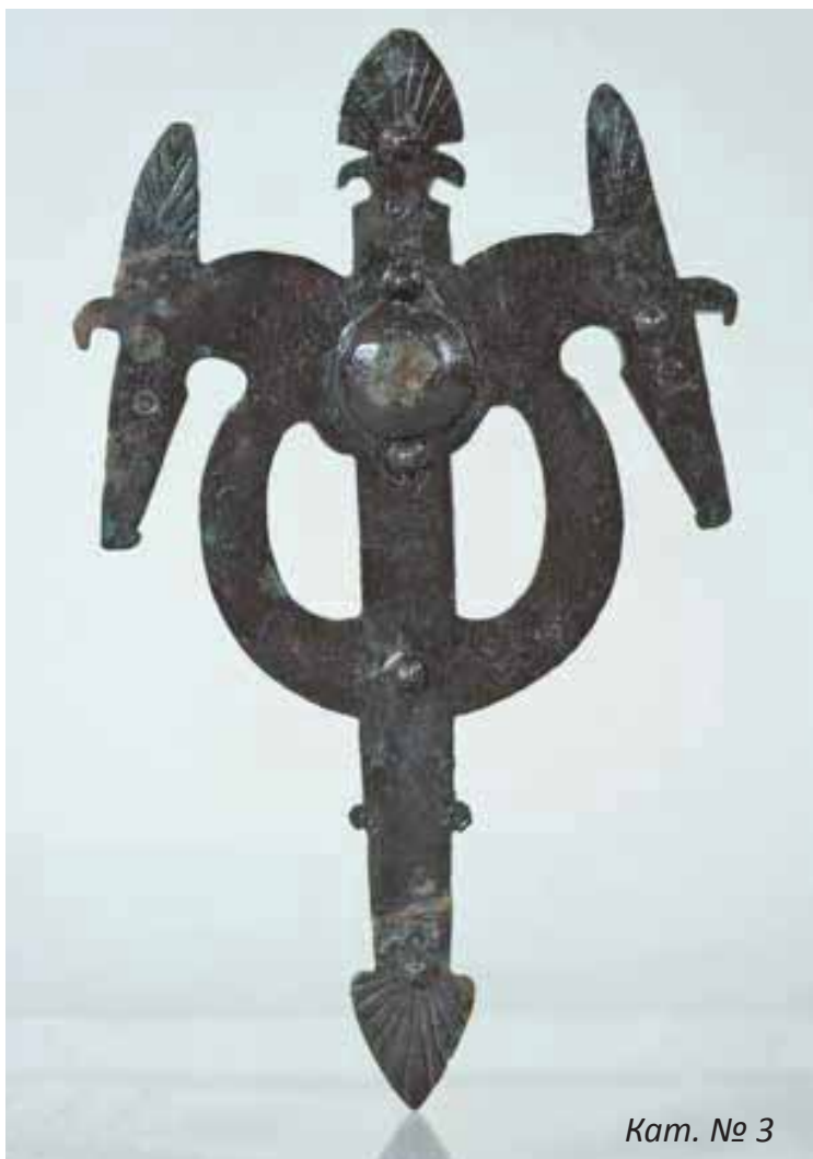
Кат. № 3