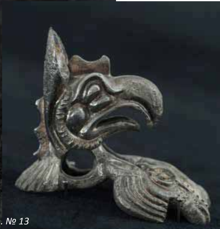
Кам. № 13