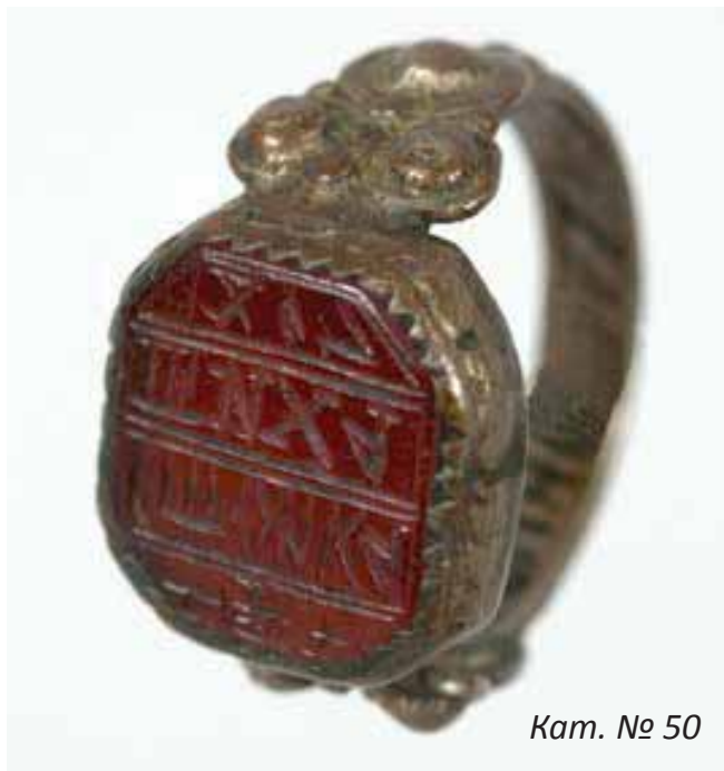
Кат. № 50