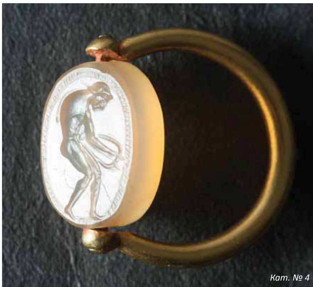
Кат. № 4

Великолепен образец на тракийската глиптика е пръстенът – печат от с. Крушаре. Върху полускъпоценният камък ахат е гравирана сцена,