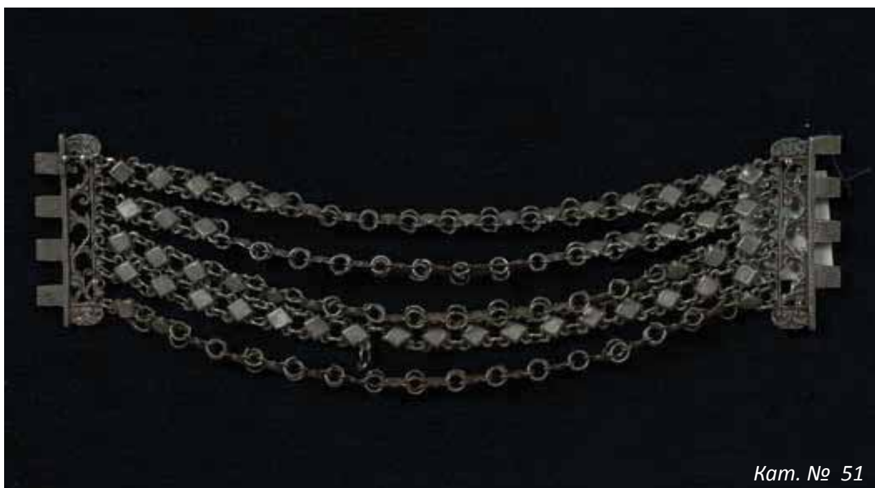
Кат. № 51