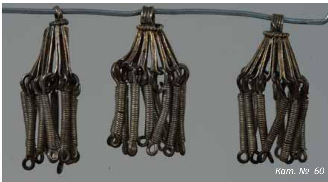
Кат. № 60