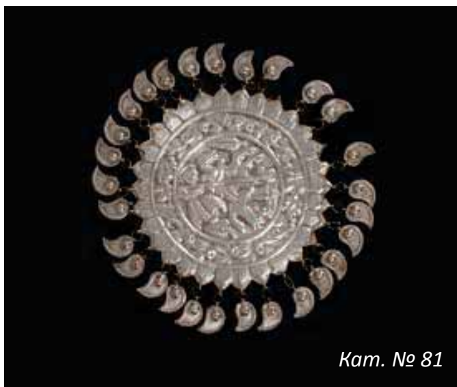
Кам. № 81