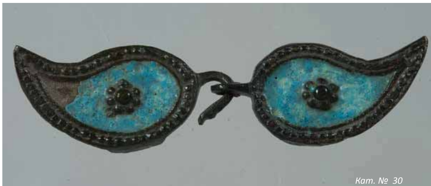
Кат. № 30