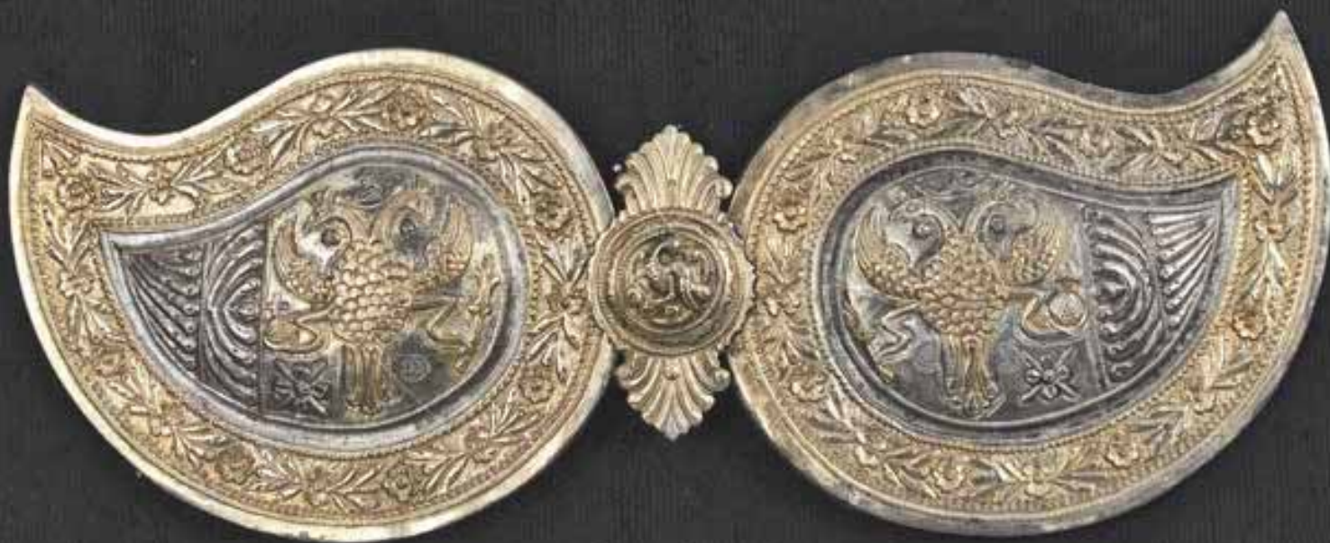
Кат. № 68

Колекцията от пафти, с която разполага музеят, е изключително богата не само като разновидност на вложения благороден метал – злато, сребро, сребърна сплав и седеф, но и като форма – кръгли, палметовидни и правоъгълни, и като начин на изработка – лети, изчукани, филигран, гранулация, като видове орнаментика – растителна, животинска, антропоморфна, като сюжети – библейски, изображение на светци, градски пейзаж, като големина – от най-големи до миниатюрни, начин на украса – с разноцветни камъни, ниски и високи релефи, апликации. Това голямо разнообразие предполага и също толкова голямо многообразие от домашно изработени колани, като материал – вълна, памук, сърма, коприна, като дебелина, плътност, ширина, здравина и др. Разбира се, големият майсторлък е да бъде постигната нужната хармония и се намери точното съотношение и на всеки чифт пафти да съответства конкретен модел колан. Наистина запазените образци впечатляват, както с майсторската си изработка, така и с получения баланс между отделните материали и модели.