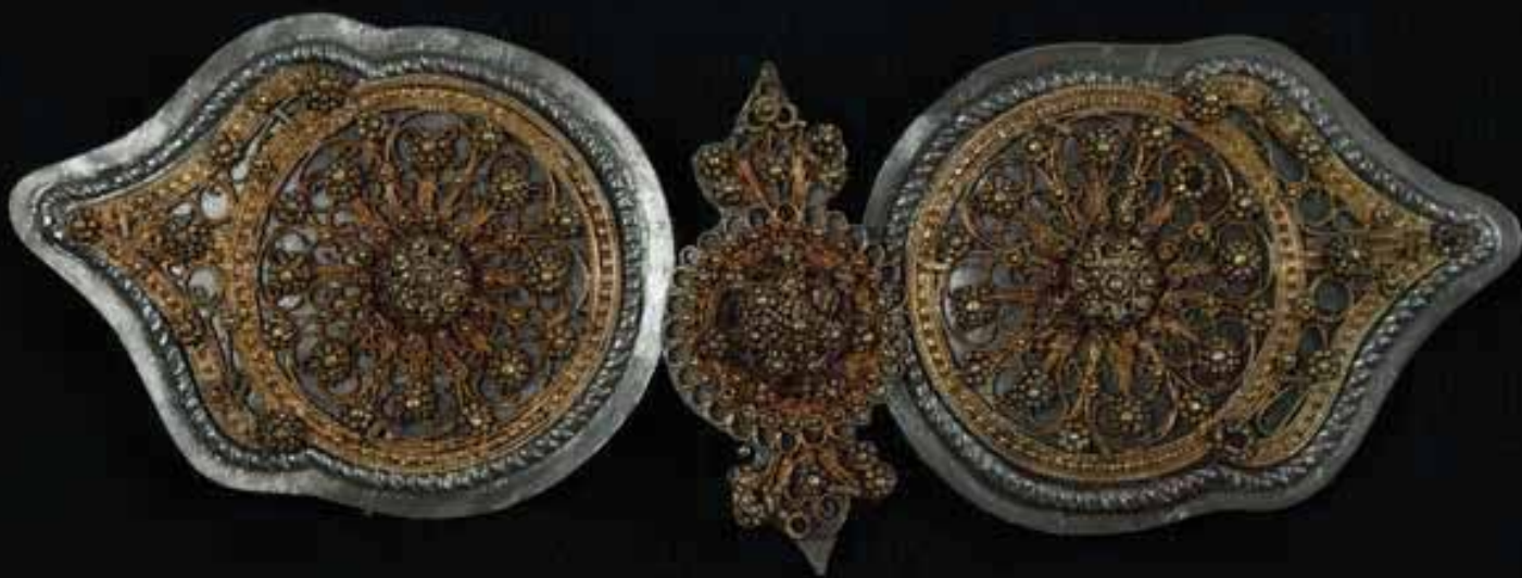
Кат. № 66