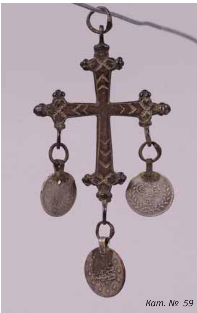
Кат. № 59

От накитите за шия най-разпространени са огърлиците, герданите,