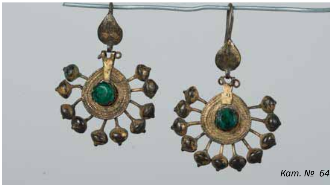
Обеци, бронз със стъклено зелено ядро, 19 век

ските златари похвати, радващи се на особена почит и внимание. Чрез първия се правят малки гранулки /зрънца/ от злато или сребро, които се разпръскват в определен ред и ритъм, а чрез втория се постига фино оцветяване посредством прах от цветно стъкло, леко загрят, за да се разтопи и проникне в металната повърхност или пък разтопения емайл се нанася направо върху украсата. Според мястото, на което се поставят накитите, те се разделят на накити за глава, за шия, за гърдите, за ръцете и за кръста.