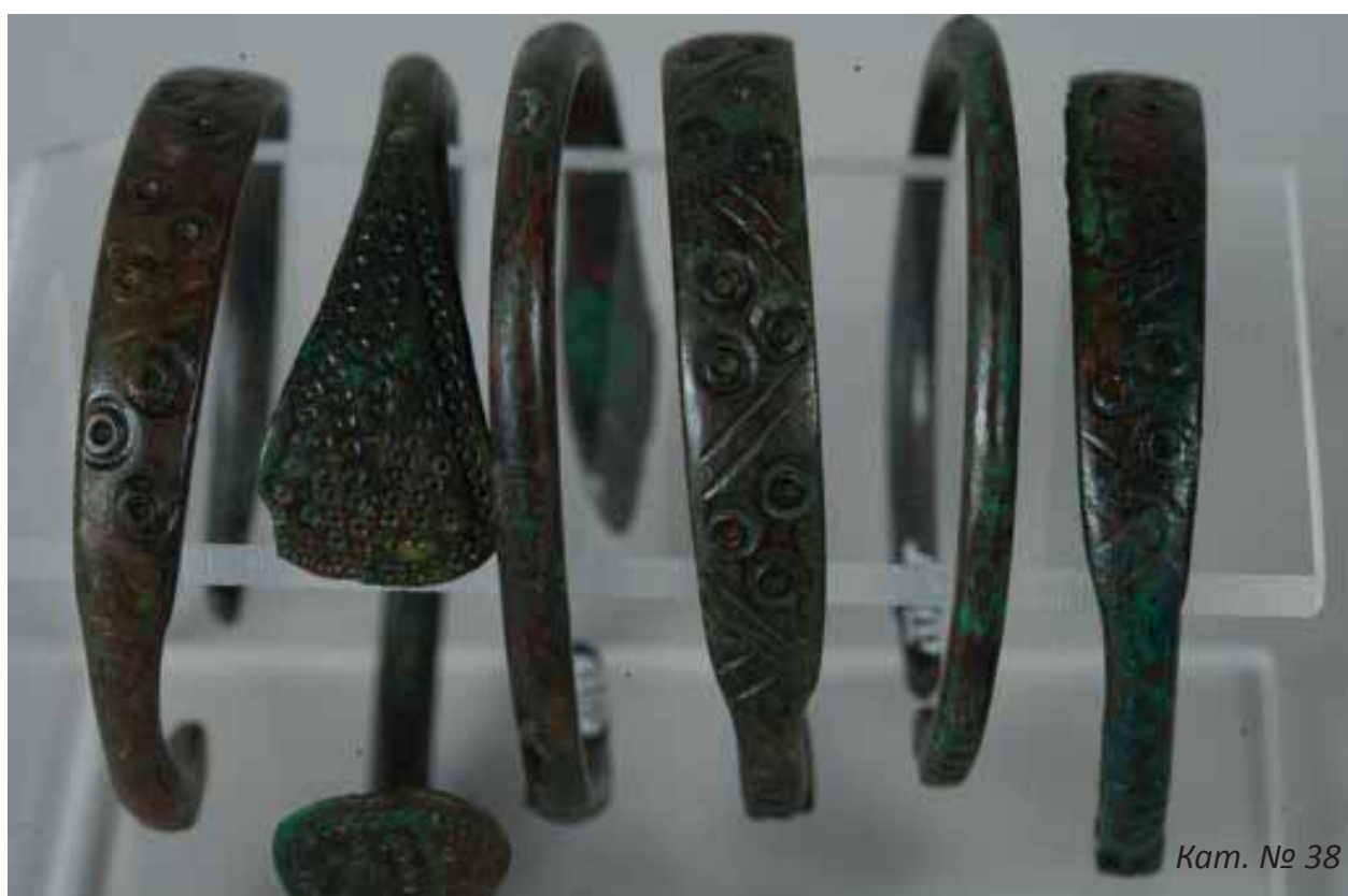
Кат. № 38