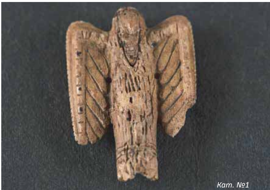
Орел от кост, бронзова епоха (3500 – 1200 г. пр. Хр.), с. Камен, Шекерджа могила

Като част от облеклото украшенията имат конкретно прагматична функция и са в съответствие с вкуса и естетическите потребности на носителите си. Използват се за закопчаване на дрехи, обувки и колани, за закрепване на прическата. Но в древността те са натоварени и с конкретни митологични представи, определящи ролята им на амулети и талисмани с апотропейна функция, а от друга страна, подчертаващи религиозния и социален статус, съотносими с конкретен култ, изповядван от притежателя им. Като цяло накитите са израз и на типичната за съответната епоха мода, но в унисон с наследената традиция.