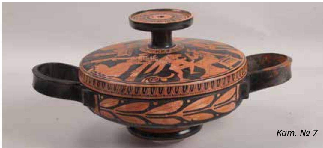
Кат. № 7

Регионалният исторически музей - Сливен представя в тази изложба великолепни образци на тракийската торевтика. Шедьовър на тракийското пластично изкуство, представлява сребърната украса на кон-начелник с грифон; псалии със сребърни грифони, сребърни апликации, звънчета. Начелникът е изразителна триизмерна пластика на митичното същество – грифон. Майсторът с финес предава чертите на фантастичното същество. Умело насочва вниманието на зрителя към допълнителните елементи от скулптурата – двете конски глави, сграбчени от митичния хищник. Майсторството на изработката говори за дългогодишна традиция в металопластиката. Несъмнено в Тракия съществува много добра школа, която разпространява своите произведения в Балканския полуостров, Мала Азия и северното Причерноморие. Друг пример на тракийската торевтика са пластичните