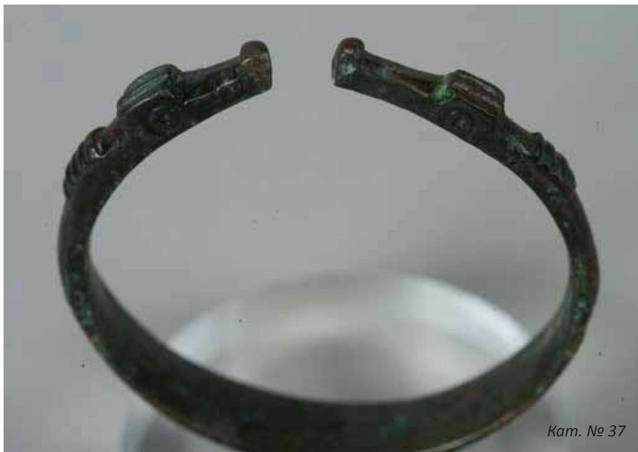
Кат. № 37

Изложба от фондовете на РИМ Сливен в Музея на НБУ