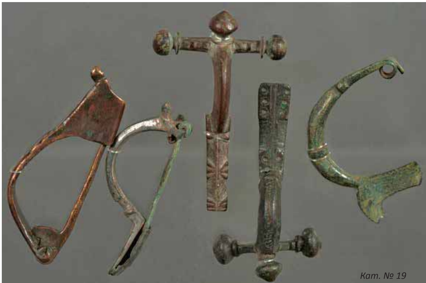
Кат. № 19