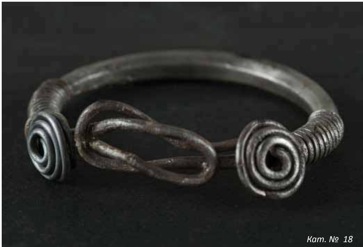
Кат. № 18