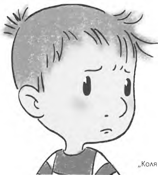
„Коля и стариците“ – Русия, Анна Юдина

Тазгодишното издание не направи изключение в това отношение и потвърди максимата, че анимационното кино дава живителна храна за фантазията, емоциите и разума на нашите деца.