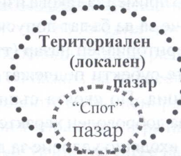
Фиг.3. Териториален (локален) пазар

доставка) сделки. Спецификата на сделките, които обичайно се сключват на териториалния пазар ни позволяват да го причислим към “spot” пазарите. На териториалния (локален) пазар би следвало да се формира цена, която е представителна за определена област, областен град, общи-