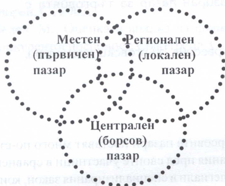
Фиг. 1. Структура на националния организиран пазар

акцентираме, че това е едно условно разграничаване на пазарните сегменти направено в теоретичен аспект. Макар и теоретичен, идеята на този анализ е да разпише една примерна схема за структуриране на пазар на дървесина в национален мащаб, съобразно реалностите в страната. Ще разгледаме в теоретичен порядък структурата на системата на националния организиран пазар и паралелно ще анализираме реалностите в страната.