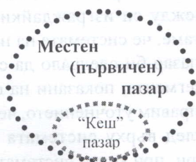
Фиг. 2. Местен (първичен) пазар

Първия елемент на системата е Местния (първичен) пазар . Основната функция на този пазарен сегмент е да формира първоначалната цена на даден актив* т.т. за първи път обекта на търгуване се представя на пазара, където по същество актива получава своята първоначална реална пазарна стойност – цена. Цената форми-