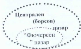
Фиг. 4. Централен (борсов) пазар

Третият елемент от системата на националния организиран пазар е централния (борсов) пазар - високоорганизиран, силноконцентриран и бързоликвиден "spot" или "futures" пазар за търговия главно с неналични стоки. На борсовите пазари по дефиницията покупко/продажбите на активи се осъществява посредством масовото сключване на "forward", "futures" и "options" сделки. Спецификата на фючърския (борсовия) пазар най-пълно се изразява посредством сделките сключвани на него: