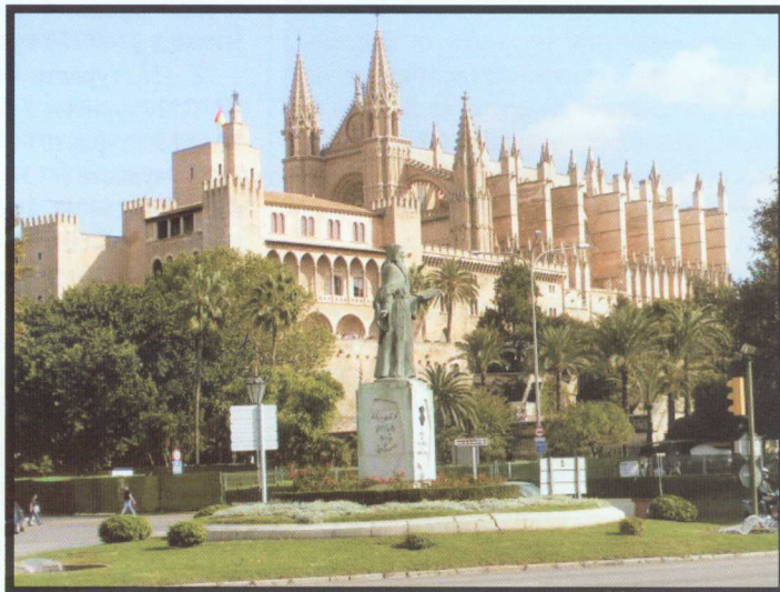
Дворецът и катедралата в Палма де Майорка

Испания, страната на контрастите, е известна с многобройните си фиести и карнавали, темпераментното южняшко население и най-дългия ношен живот на континента. Представлява един от културните центрове на Европа, прочут със световноизвестния музей "Прадо", художествената галерия "Тисен-Борнемица", римски акведукти, историческо наследство на маврите, внушителни замъци, катедрали, манастири, дворци, крепости, господарски къщи и двореци. Съчетание на типична средиземноморска кухня със заведения за бързо хранене, модерна музика с испанско фламенко, класически испански художници като Ел Греко и Веласкес с модернисти като Пикасо и Дали.