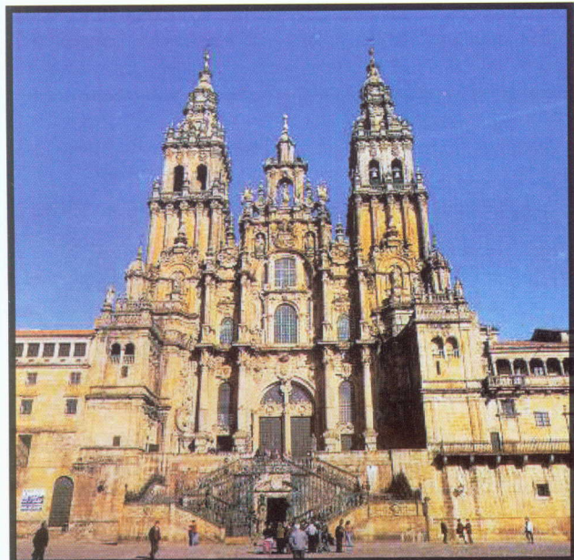
Катедралата в Сантяго де Компостела