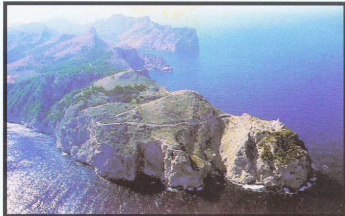
Форментор и Порталс Ноус, Балеарски острови