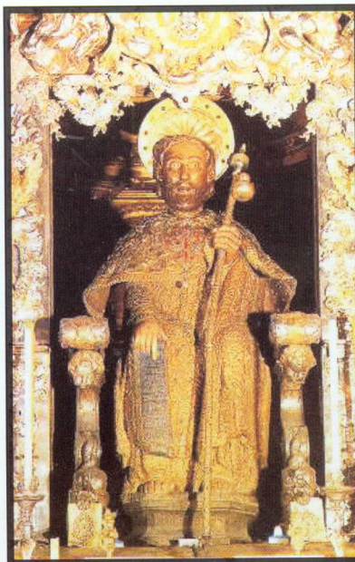
Олтарът на катедралата