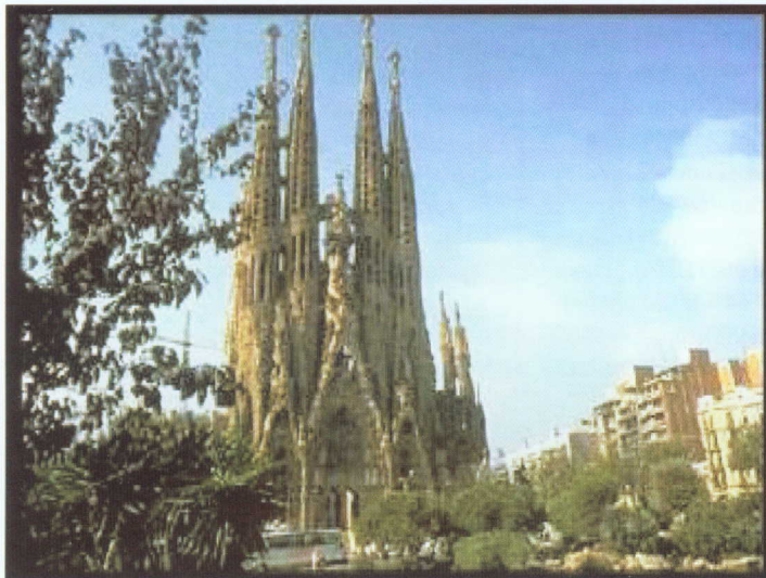
Катедралата "Саграда Фамилия" в Барселона