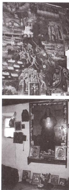
Ил. 7. Храм „Св. Георги“ в село Златолист – „Страшният съд“ (детайл).