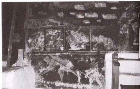
Ил. 8. Храм „Св. Георги“ в село Златолист – „Страшният съд“ (детайл).

В процеса на работа по дисертационния си труд попаднах на нови интересни и важни сведения за произхода, родовите връзки и творбите на зографите от този забравен род образописци 2 . Оказа се, че представители на тази фамилия работят в задруга със зографа Милош Яковлев, който произхожда от същия регион и с когото те имат роднинска връзка 3 .