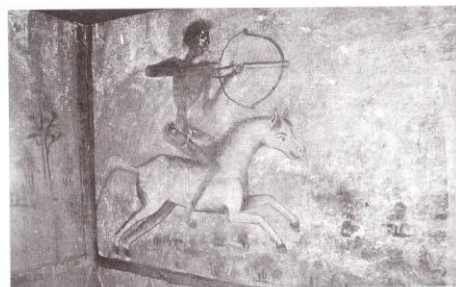
Ил. 1. Храм „Св. Георги“ в село Златолист – св. Харалампий, св. Христофор, св. Стилиян, св. Йоан Рилски.