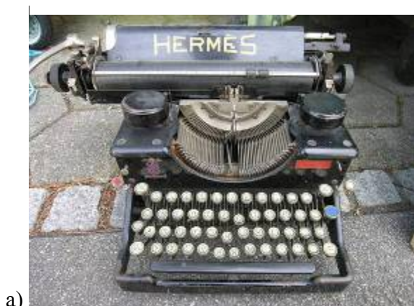
Обр. 2 6