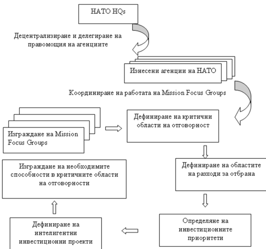
Фиг. 1. Модел за координиране на дейността на MFGs

Функционирането на всяка една от тези групи ще изисква ефективно ръководство (като пример от страна-членка лидер), а като цяло всичките групи ще имат потребност от ефективно координиране от страна на НАТО или на (изнесени) агенции на Алианса, което ще позволи последните да бъдат по-близко до групите, а от там като следствие и по-полезни в процеса на координиране.