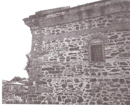
Храм „Св. Никола“ в село Тополница – източната част на северната стена с дата на градежа.