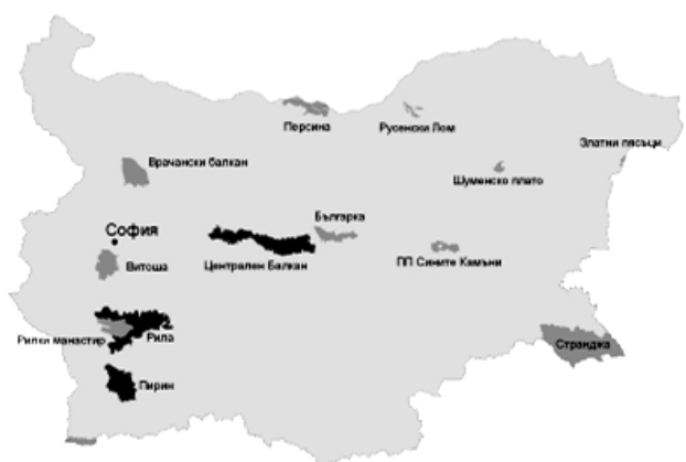
Фиг. 1 Fig. 1

дял не е достатъчен (Национален център за изучаване на общественото мнение (НЦИОМ) – 2003, 2004) (фиг. 2).