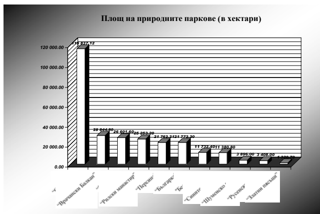
Фиг. 3 Fig. 3

Дял от площта на природните паркове (в %)