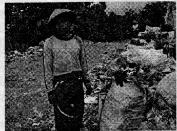
Фиг. 1. Събирач от Джакарта

дъци, събрани от сметищата на Индонезия. Специално ангажирани събирачи от Джакарта подбират и сортират боклуците и ги подготвят за нуждите на проекта. Артикулите са изключително разнообразни и представляват всякакви чанти, портмонета, несесери и др., изцяло ръчно изработени от местните жители. (Фиг. 1)