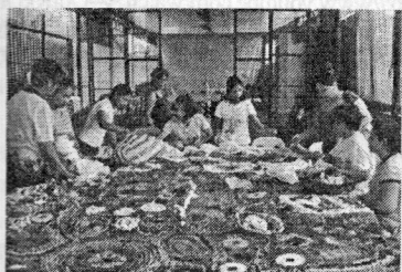
Фиг. 3. Организацията „Invisible sisters“