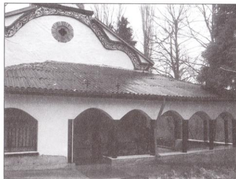
Храм „Св. Никола“ в село Червен брег, Дупнишко