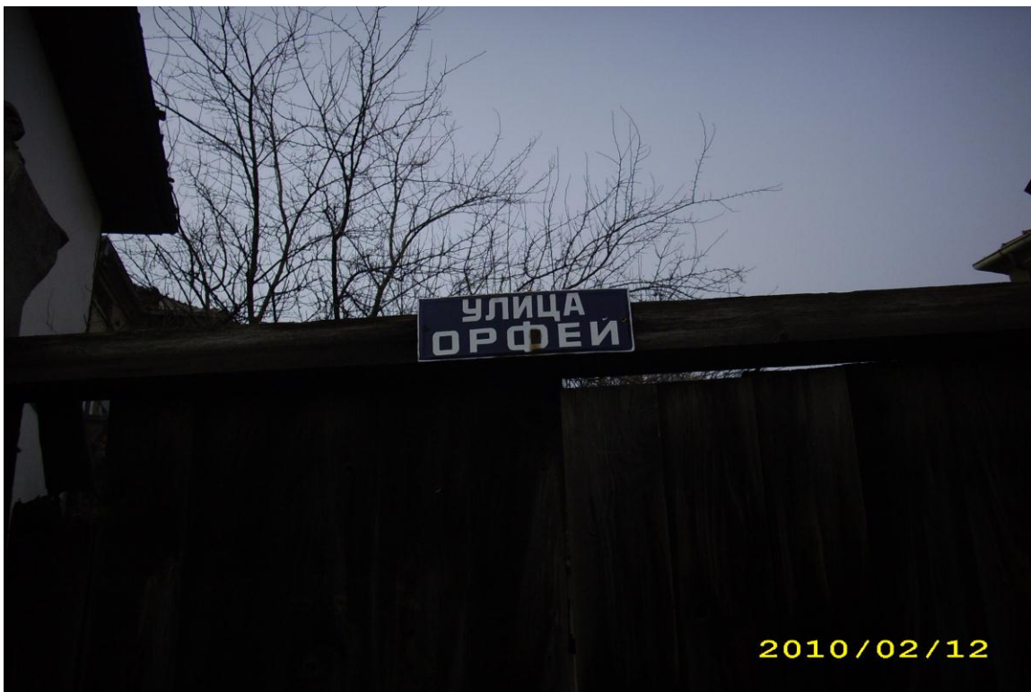
Снимка на улица в Йвайловград

Така древни реалии, вписани в историческия наратив, са припознати като „наши” и функционират в публичното пространство на общността. А материалността на римската вила „Армира” започва да функционира като „герб” на Ивайловград. Съвременните разработки върху гербовете на българските градове показват, че те се създават именно в съвременността. Те получават своите знаци не по традицията и каноните на хералдическата система от символи, а в мрежата от отношения между администратори и художници, произвеждащи образи по теми от артефакти на културното наследство (Антонов, 2003, 192 – 205). Ето защо един от съществените процеси, които по-горе бяха проследени, е процесът на „въвеждане” на археологическата материалност в панорамата на културното наследство, за да се осъществи функционирането ѝ както на национално, така и на местно равнище.