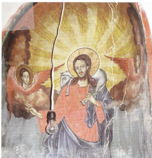
Храм „Св. Георги“, Христос Добрият пастир Church of St. George, Jesus Christ the Good Shepherd

Поминък на населението в миналото са животновъдство (овце, кози, свине), земеделието (ръж, ечемик, царевица, тютюн, сусам, овощия), дърводобивът и кираджийството. Днес населението се състои от няколко десетки жители и от старите производства не е запазено почти нищо.