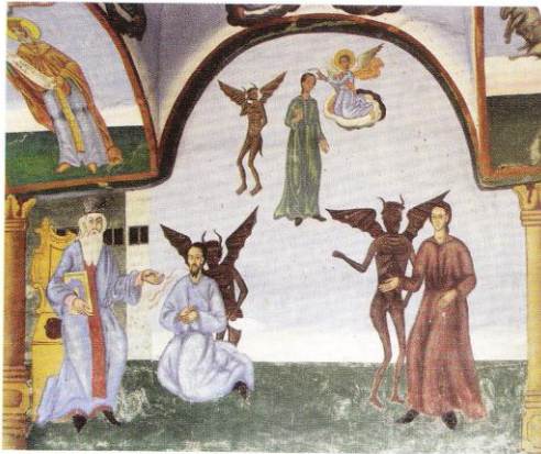
Храм „Св. Георги“, Праведно изповедание Church of St. George, Pious Confession