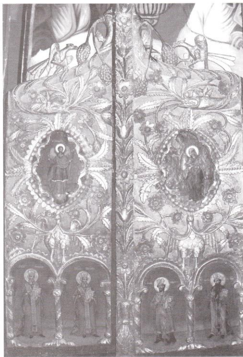
Храм „Св. Георги“, Светите двери Church of St. George, Holy Gates

От запазената живопис става ясно, че зографът притежава завиден декоративен усет. Палитрата, която използва, е ярка и интензивна, особено в орнаменталната украса. Композициите му са доста сковани. Зографът допуска