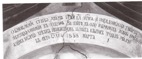
Храм „Св. Георги“, Възпоменателен надпис Church of St. George, commemorative inscription

427 къщи – всички български, а в църквата на селото се служило смесено – на български и на гръцки, а в българското училище се обучавали 28 ученици 9 . Девет години по-късно, през 1900 г., според изследванията на Васил Кънчов в Игуменец има 430 домакинства, всичките български 10 . А според статистиката на секретаря на Българската екзархия Димитър Мишев през 1905 г. християнското население на Егуменец се състои от 3776 българи, всичките екзархисти. В селото функционира едно начално българско училище с един учител и 24 ученика 11 . Селото е присъединено към България по време на Балканската война от 1912 г.