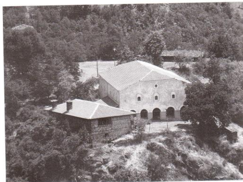
Храм „Св. Георги“, с. Игуменец (Чурилово) Church of St. George, village Igoumenets (Churilovo)

Село Игуменец се споменава в османски регистри от 1570, 1611–1617, 1660, 1664 и 1665 г. 8 Според първия регистър в селото (записано като Гуменица) живеят 1 мюсюлманско и 209 християнски домакинства. През XIX в. Игуменец е най-голямото село в Петричката каза. Според Георги Стрезов към 1891 г. Игуменец има