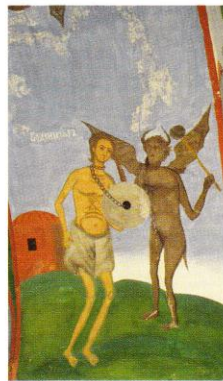
Храм „Св. Георги“, Мъчение на воденичар Church of St. George, Torture of the miller

В протезисната ниша е изобразен Христос Добрият пастир – една от най-старите метафори за Христос, който води вярвачите, закриля ги и се грижи за тях. Добрият