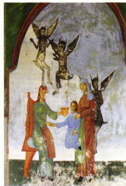
Храм „Св. Георги“, При врачката за цяр Church of St. George, By the sorceress for remedy

пастир е познат още от мозайките в Равена (V в.). В епохата на Възраждането този образ намира своето място в украсата на църковния интериор у нас. Сцената има пряко евхаристийно-литургично значение, обвързано с нейното място в олтара. Като противодействие на протестантските реформи, в католическия и православния свят се засилва учението за евангелския произход на Светата литургия и нейния жертвен характер. Тези реформи са пряк отглас от решенията на Трентския събор и навлизат у нас чрез влиянието на Карловацката митрополия и украинската богослужебна литература 14 .