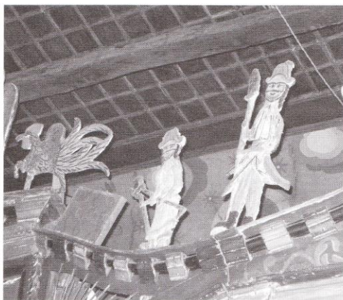
Храм „Св. Георги“, Украса на иконостаса Church of St. George, decoration of the iconostasis

ните светци и празници (отляво на дясно): Рождество Богородично, св. Антоний, св. Атанасий, Възнесението на св. пр. Илия, Св. Георги убива ламията, Св. Богородица Одигитрия, Христос Вседържител, св. Йоан Кръстител, св. Никола, св. Спиридон, Св. Димитър на кон и св. Параскева. Върху вратата на протезиса (север) е изобразен Св. архангел Михаил взема душата на богатия, а на вратата на диаконикона (юг) е изобразен в цял ръст св. архангел Гавриил. И двете изображения са в овални полета, а пространства помежду им са украсени с букети от рози.