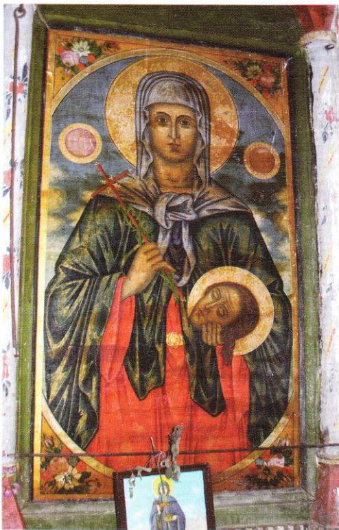
Храм „Св. Георги“, икона на св. Петка Church of St. George, icon of St. Paraskeva

една хармонична пропорция, композициите му са доста претрупани и недобре организирани. Резбата може да бъде определена като доста груба, но ярките цветове ѝ придават една колоритна неповторимост. Царските двери са резбовани с шест традиционни полета, изпълнени с изображения на св. Богородица и архангел Гавриил от сцената Благовещение. В другите четири полета са разположени великите отци на църквата св. Атанасий Александрийски, св. Григорий Богослов, св. Йоан Златоуст и св. Василий Велики. Резбата е доста плоскостна. Основният декоративен мотив е акантовият лист, който запълва пространствата между отделните живописни полета. Листата на аканта излизат от два орела, кашнали върху арките, както и от зъбестите уста на двата змея, разположени в горната част на вратите. Опашките на змейовете завършват с птичи глави. Архиерейският трон, проскинитарият, амвонът и киворият на Светата трапеза са резбовани и имат полихромна украса. Цветовете имат същия характер като иконостаса. Лъвовете в подножието на трона са изобразени само с главите си, които наподобяват по-скоро гущери и имат поразително сходство с някои живописни изображения от откритата галерия, както споменах по-горе в текста. Резбарите, изпълнили иконостаса, св. Трапеза и архиерейския трон, също остават неизвестни. Надявам се, че след въвеждането в научно обръщение на този па-