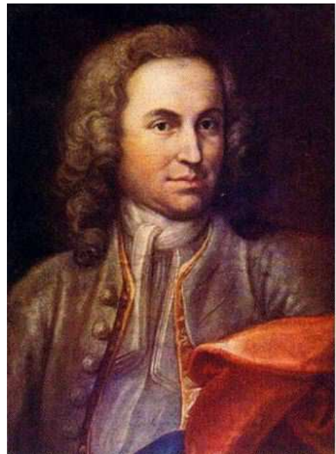
Портрет на младия Й. С. Бах (?)

Йохан Себастиан Бах (1685-1750) – най-велика, ненадмината архитектуроника!