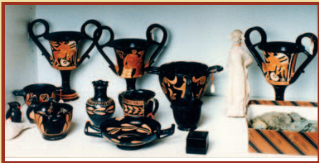
Антични предмети от склада на контрабандиста Джакомо Медичи

метниците от Ниневия, изнесени от О. Х. Лейърд през XIX в., каза Ренфрю, са били научно разкопани и тяхната историческа информация не е загубена. Естествено, тяхното притежание също поставя редица етични и законови проблеми за културното наследство на всяка страна.