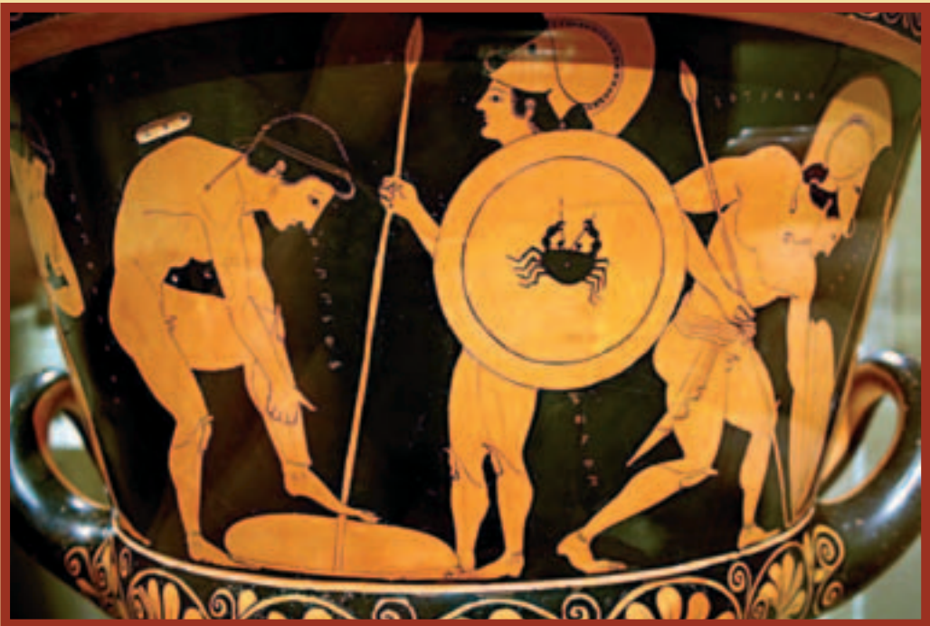
Кратерът на Ефроний - детайли

то минало, която се унищожава безвъзвратно при тази дейност, когато находките са извадени от техния археологически контекст и липсва професионална археологическа документация. Той