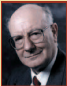
Проф. Колин Ренфрю

Кулминацията в дискусиите на тази тема, обаче, беше връчването на годишната награда Бийкън (= "Фар") на организацията СЕЙФ (SAFE – съкращението като дума означава "запазен, спасен", а под отделните му букви се крие фразата "Запазване на антиките за всички"). Това е неправителствена