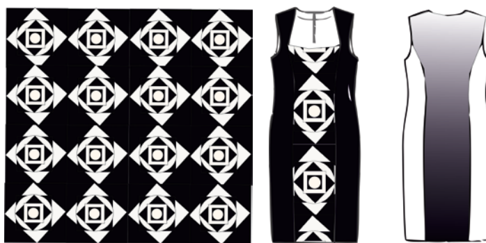
Фиг. 4 Десен и облекла Камелия Матеева – 1 курс БП Мода

В следващият етап на работа студентите внедриха абстрактните десени в дамски облекла. Те прецизно изчертаха техническите скици като упражняваха техниките за трасиране на изображения, настройки на контура и ефекти за поместване на растерно изображение във векторни фигури. Отличните резултати от осъществяването на проекта провокираха преподавателите да организират изложби, в които младите автори да покажат своите постижения. (Фиг.4,5,6,7,8)