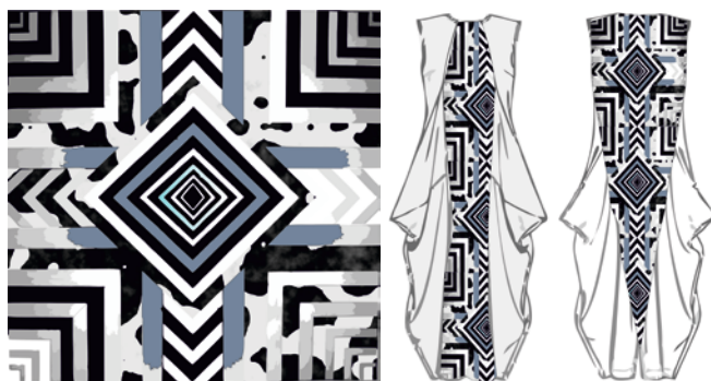
Фиг.6 Десен и облекла Кирил Мънев – 1 курс БП Мода