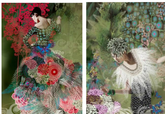
Фиг. 4. Илюстрации Sara Arnett

Дизайнерката Sara Arnett е пример за художник изразяващ себе си с дигитални техники. Нейните илюстрации са пъстри и свежи. Проектите ѝ напомнят свежа цветна градина. Флоралните мотиви преобладават. Многообразието на природата и животинския свят са основен източник на вдъхновение за младата художничката. В своята работа тя смесва дигитална фотография и векторни фигури. Резултатът е единанова цветна вселена, в която женската красота и самобитността на природата взаимно се допълват. (Фиг.4)