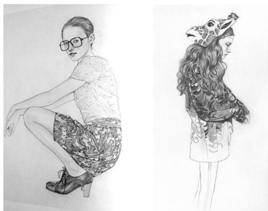
Фиг. 1. Илюстрации Jenny Mortsell

стила ѝ. В същото време дизайнерката предлага един съвременен прочит на класическите графични техники, който е особено впечатляващ. (Фиг.1)