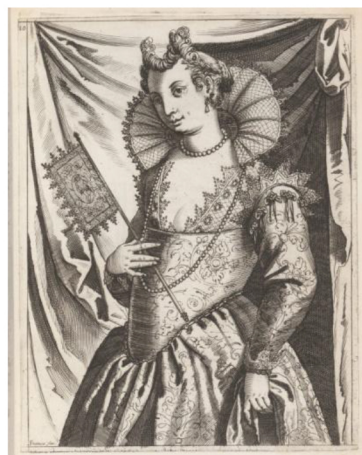
Фиг. 2 Giacomo Franco, гравюра върху дърво към книгата „Habiti delle Donne venetiane”

венециански художник Giacomo Franco можем да проследим методичното полагане на всеки отделен шрих, с което се характеризират дървените гравюри от епохата на Възраждането. (Фиг.2)