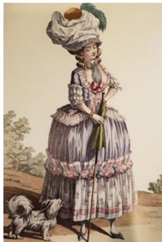
Фиг. 5 Claude-Louis Desrais, „La Galerie des Modes“, серия цветни модни гравюри офорт

ват илюстрации, в които присъстват фигури изобразени в профил или в гръб към зрителя, което е направено с цел представяне визията на дрехата от всички възможни гледни точки. (Фиг.5)