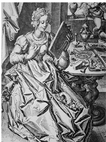
Фиг. 1 Jacques de Grey II, Venitas: Young woman with a Mirror, гравюра върху метал

развитие. Подемът е тясно обвързан с техническия прогрес и усъвършенстването на печатните технологии. Анализирайки разнообразните книжни издания, сборници, журналы и списания достигнали до нас можем да констатираме стабилна закономерност по отношение на взаимодействието на модната рисунка с другите форми на изкуството. Различните художествени стилове, които протичат в Европа оказват пряко отражение върху стилистиката, композицията, колорита и дизайна на модната илюстрация. Така например първите модни гравюри, които се появяват през епохата на Ренесанса търпят сериозно влияние от общата стилистика характерна за епохата. (Фиг.1)