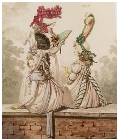
Фиг. 5 Nikolaus Wilhelm von Heideloff, „Gallery of fashion“, акватинт

техните елегантни тоалети по време на разходка, в операта, на концерт и други светски събития. Интересното при отпечатването на рисунките било ръчното нанасяне на цвета в допълнение с нанасяне на златна и сребърна украса върху определени области от костюма. На места били инкрустирани миниатюрни бижута, което значително повишило цената на изданието. Луксозната изработка била в пълен синхрон с художествения изказ. Читателите получавали истинска естетическа наслада, която изпитваме и ние съвременните дизайнери прелиствайки богато илюстрирания журнал. Списанието имало кратък живот и поради високата си себестойност било достъпно само за тесен кръг от елита въпреки това заслужава да му бъде обърнато специално внимание поради новаторския подход при изработката на гравюрите. (Фиг.6)