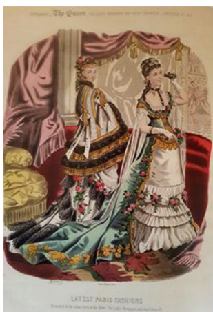
Фиг. 8 “The Queen: The lady's Newspaper and Court Chronicle”, цветна литография

В началото на двадесети век пикът в развитието на модната илюстрация е белязан от появата на една нова графична техника навлязла във Франция чрез японската култура. Това била “pochoir”, която бързо се развила и станала любимо изразно средство на модните илюстратори. При печатния процес се спазвала следната последователност на действията: цветът се нанасял ръчно върху литографията на отделни слоеве. За тази цел се подготвяли шаблони за всеки отделен цвят. Френските печатари взаимствали технологията и доразвили техниката, която водела началото си от тампонния печат използван при изработката на щампите на японските кимона. През 1890 г. находчивият френски печатар Andre Marty я адаптирал за печатарските преси и започнал да произвежда книги. Идеята му се оказала много практична и дала тласък на развитието на модната илюстрация през епохата на арт деко и джаза. Така в околностите на Париж се появили няколко ателиета, които работели само в новата техника. Голяма част от списанията издавани в началото на миналия век били отпечатвани чрез pochoir. Списанието “Journal des Dames et des Modes” използвало популярната техника, за цветните вложки в съдържанието както и за кориците. Знаменити автори като Helen Dryden, Paul Iribe, Léon Bakst, Erté и др. създали едни от най-разкошните илюстрации посредством шаблонната техника. (Фиг.9)