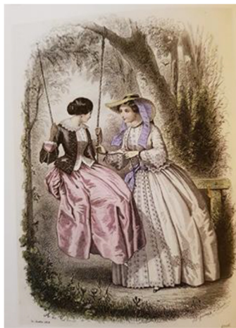
Фиг. 7 „Petit Courier des Dames“, гравюра върху метал 1854 г.

получили свои аналози в Германия, Италия, Англия и др. През 1821 до 1868 г. бил издаван седмичният моден журнал „Petit Courier des Dames“ който бил отпечатван извън Париж. Журналът имал компактен дизайн, брилянтно изрисувани илюстрации, които му спечелили първенството сред нароилите се седмични издания. (Фиг.7)