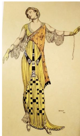
Фиг. 9 Léon Bakst, “Journal des Dames et des Modes”, ръчно оцветен pochoir върху литография, 1912 г.

те постепенно били заменени от снимки. В края на двадесети век интересът към ръчната рисунка и модната илюстрация провокира създаването на редица нови техники, които обаче не могат да се сравняват с образците от миналото.