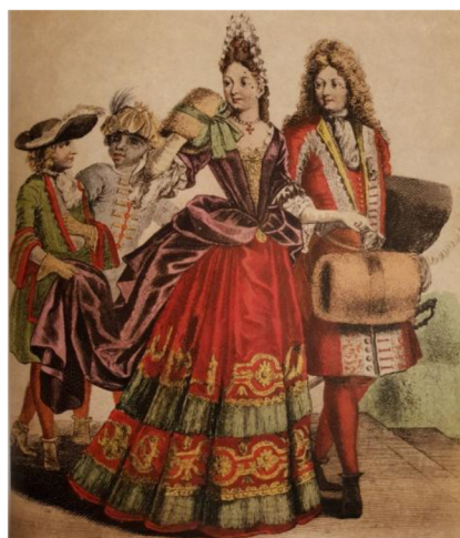
Фиг. 4 The Bonnard brothers, “Personages de Qualité”, гравюра с нанесено цветно покритие

ра на костюма от този исторически период, въпреки това педантичното изграждане на всеки детайл ни дава богата информация за изобилието от дантели и апликации, с които са били обшити дрехите на висшата класа през барока и рококо. Най-големи усилия изисквали обемните прически и аксесоарите. Отделено е и внимание на екстериора, които също е разработен. Забелява се убедителното представяне на перспективата и степенуването на отделните планове в композицията. Книгата „Personages de Qualité“ издадена през 1680-1715 г. е един от най-подходящите примери за състоянието на модната илюстрация през седемнадесети век. Квалитетното издание е било изработено под надзора на куратора на кабинета кралските печатници и съдържа богата колекция от цветни дървени гравюри. Благодарение на тази книга френската мода била пренесена във всички кралски дворове в Европа. Красивите цветни илюстрации мигновено грабнали жадните любители на стила и естетиката. (Фиг. 4)