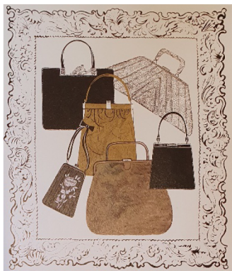
Фиг. 4. Реклама на чанти, 1958 г.

Живата линия на художника може да бъде отличена в поредица скици на модели, публикувани през следващите години. Техните силуети са лаконично представени само с една линия, която е много изразителна и красноречиво представя конструкцията на човешкото тяло. (Фиг.5)