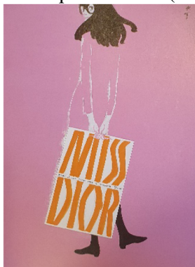
Фиг. 7. Реклама на парфюм Dior, 1967/8 г.

много други. Почеркът на художника е толкова популярен, че сами по себе си представляват един прекрасен пример за освободеност и експресивност на рисунъка, притежавани от твърде малко артисти. Авторът работи основно с туш и акварел, изграждайки формата с дебела четка. Като част от дизайна художникът използва цветни точки и равни петна, които играят ролята на заден план. Здравата конструктивна рисунка е представена по различен начин в свободните му ескизи, като доминираща е черната линия, която оформя силуета. През 1967/8 г. художникът е ангажиран за рекламата на парфюми за компанията Dior. При изпълнението на композицията художникът решава да използва техниката на колажа и гваш. Смелите мазки на четката са свидетелство за неговата експресивност. (Фиг. 7)