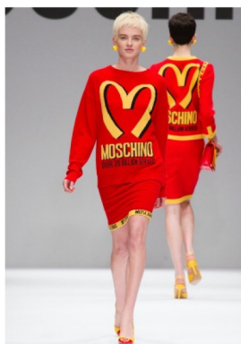
Фиг.10. Модна колекция на дизайнера Jeremy Scot, 2014 г.

През следващите години попартът завладява цяла Европа. Стилът е еkleктичен и лесно разпознаваем. Попартът служи като вдъхновение при създаването на редица модни колекции. Дизайнерът Jeremy Scot е сред мнозината, почерпили вдъхновение от еkleктичността на този интересен художествен стил. Неговата колекция, създадена през 2014 г. за търговската марка „Moschino“, е изцяло вдъхновена от творчеството на Andy Warhol. Силните послания от модния подиум, които дизайнерът отправя чрез своите модни колекции, са много красноречиви. Дизайнерът успява да представи своята концепция по най-изтънчения възможен начин, придавайки на облеклата една съвсем нова съвременна визия. (Фиг.10)