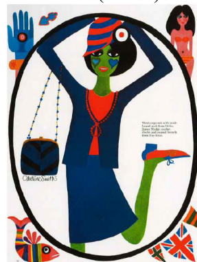
Фиг.9. Илюстрация на художничката Caroline Smith в сп. „The queen“, 1965 г.

Един от авторите, оставили трайна следа в историята на модната илюстрация, е дизайнерката Caroline Smith. Нейните илюстрации са силно вдъхновени от хипи движението. Те изобилстват от ярки цветове и символи, които са вместени в фигурите. Авторката отлично е представила социалните настроения, бушуващи в обществото, в илюстрациите, публикувани през 1965 г. в сп. „The queen“. Фигурите са представени в силна стилизация, в раздвижена поза. Интересен подход към изграждането на композицията е поставянето на модела в черна рамка, която създава асоциация с карта за игра. Художничката успешно предава движенията на фигурата и същевременно представя общите характеристики на модните течения. Нейните илюстрации са много характерни. Техният колорит е наистина много впечатляващ. Интересна е и постройката на композицията, която е вкарана в кръгла рамка, която напомня облата форма на огледало. Тялото на модела смело навлиза във формата и я изпълва. Рисунките по лицето на модела подсказват една закачлива препратка към хипи движението и неговата проекция върху модата и дизайна на облеклата. (Фиг.9)