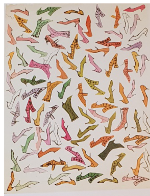
Фиг. 3. Реклама на обувки, 1959 г.

В същото време Warhol работи и върху множество реклами, предназначени за модната индустрия. През 1956 г. той реализира успешно няколко рекламни кампании за различни брандове. Цялостната рекламна визия на компанията I. Miller Shoes се оказва много успешна. Симпатичните отпечатъци на обувки веднага привличат вниманието на клиентите.(Фиг.3)