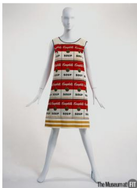
Фиг. 1. Рокля с десен на супите „Campbell's“, Музей на облеклата Ню Йорк, 1966-67 г.

като петна, зацапвания или размествания на шаблоните, за да постигне по-голям ефект на освободеност и артистизъм. Платната по поръчка на големите компании „CocaCola” и супите „Campbell's“ са особено атрактивни и представят най-пълно визията на попарта. При създаването на образите дизайнерът си служи с цветни шаблони, за да нанесе частично цвета върху изображението. Маниерната техника е използвана и при проектирането на обложки за звукозаписната компания „RCA Records”, в която дизайнерът работи в продължение на няколко години. Художникът експериментира в областта на киното, сценографията, фотографията, модата. Той създава реклами и проекти за дрехи и аксесоари в типичния попарт стил. Художникът проектира рокли от хартия в духа на попарта. Дизайнът включва повтарящи се десени с етикетите на супите „Campbell's“. Както можете сами да забележите, визията на тази дреха е доста нестандартна.(Фиг.1)