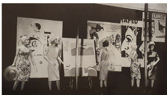
Фиг. 6. Рекламни пана Ню Йорк, 1961 г.

През 1961 г. в Ню Йорк художникът продължава да работи в областта на рекламната графика. Той разработва поредица концепции за различни брандове. Warhol разработва и мърчъндайзинг на няколко компании. Артистичният му почерк веднага се откроява в украсата на магазините на марката Vonwit Teller. Рекламните пана са разположени на витрините, зад манекените, в един от най-големите търговски обекти в града. Композициите са много въздействащи. Те представят различни сцени в стила попарт. Присъствието на комикса определено приковава вниманието в едно от рекламните пана, носещо гръмкото заглавие „Superman“. (Фиг.6)