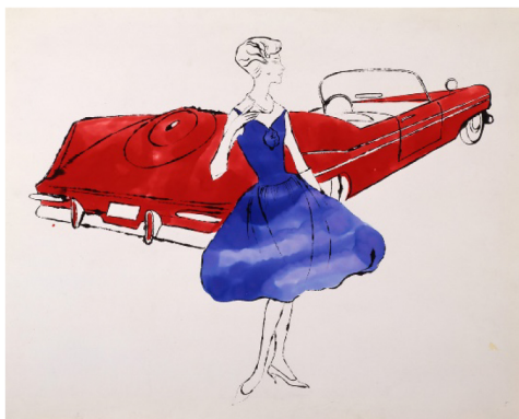
Фиг. 5. „Жена с кола“, 1959 г.

Живата линия на художника може да бъде отличена в поредица скици на модели, публикувани през следващите години. Техните силуети са лаконично представени само с една линия, която е много изразителна и красноречиво представя конструкцията на човешкото тяло. (Фиг.5)