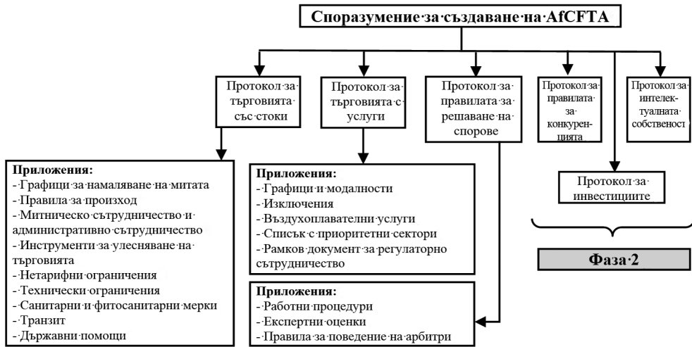
Фиг. 2. Фази на прилагане на Споразумението за AfCFTA

отстъпки и т.н.). Фаза II обхваща правата върху интелектуалната собственост, инвестициите и конкуренцията (фиг. 2).