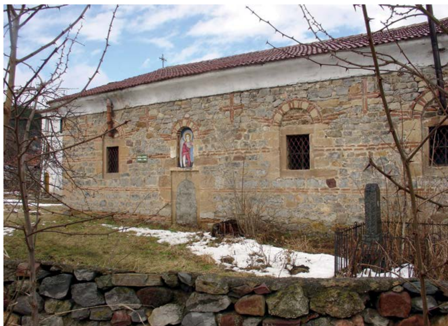
Фиг. 2. Храм „Св. архангел Михаил“ с. Студена, Пернишко. Поглед от юг.