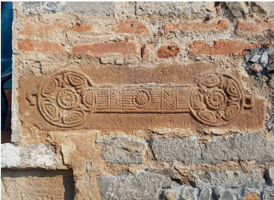
Фиг. 5. Храм „Св. архангел Михаил“ с. Студена, Пернишко. Релеф с пафти.