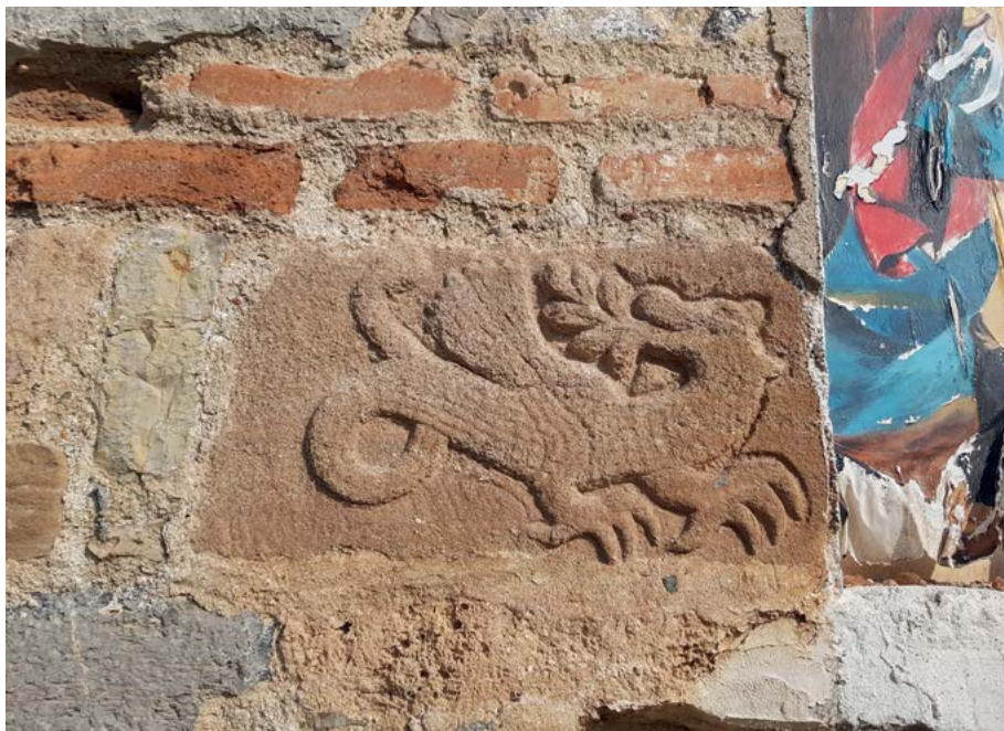
Фиг. 7. Храм „Св. архангел Михаил“ с. Студена, Пернишко. Релеф с ламя.

От лявата страна на този релеф е вграден отличаващ се каменен блок, на който е издялана годината 1846. Релефът от дясната страна на вратата е симетричен на левия, в средата е изсечен двуглав орел с корона на главата. Пространството около него отново е заето от лоза. До него отново е вграден каменен блок с изсечен надпис: съгради се черква / свети ар. михаил / 1846 година. Върху арката на западната врата са изрязани три релефа с размери 25x25 см. На средния от тях е поместена изправена птица с рогчета на главата, разперени крила и раздвоена опашка. Главата на птицата е голяма в сравнение с тялото ѝ. В релефа, отляво на централния, е изобразена глава с човешко лице, корона и крила от двете ѝ страни. Десният релеф представлява птица с човешко лице и корона на главата, с разперени крила и опашка. Тялото ѝ е представено в профил, а главата – в анфас. Между трите релефа над входната украса са вградени два плоски камъка, за разлика от тези на южната врата, които са един до друг. На северната стена няма никаква украса.