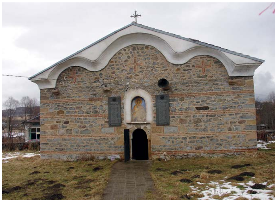
Фиг. 1. Храм „Св. архангел Михаил“ с. Студена, Пернишко. Поглед от запад.