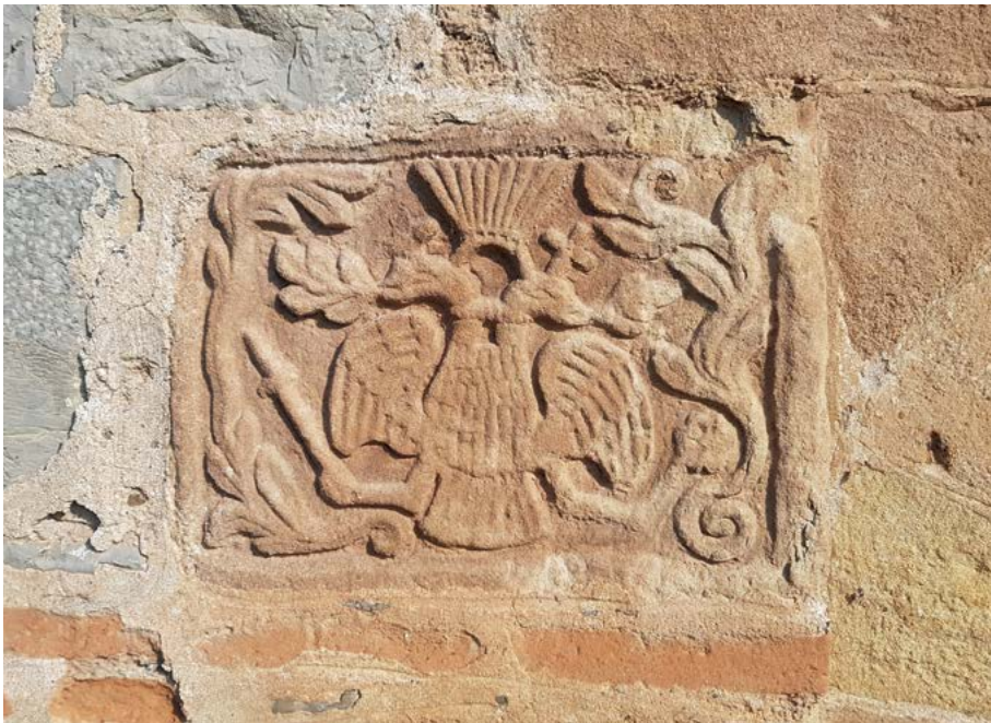
Фиг. 4. Храм „Св. архангел Михаил“ с. Студена, Пернишко. Релеф с двуглав орел.