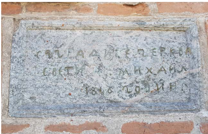
Фиг. 8. Храм „Св. архангел Михаил“ с. Студена, Пернишко. Възпоменателен надпис.

Солеят е с около 10 см по-висок от пода на наоса и е заслан с дъски 22 .