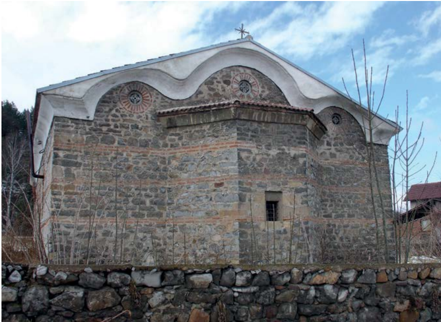
Фиг. 3. Храм „Св. архангел Михаил“ с. Студена, Пернишко. Поглед от изток.