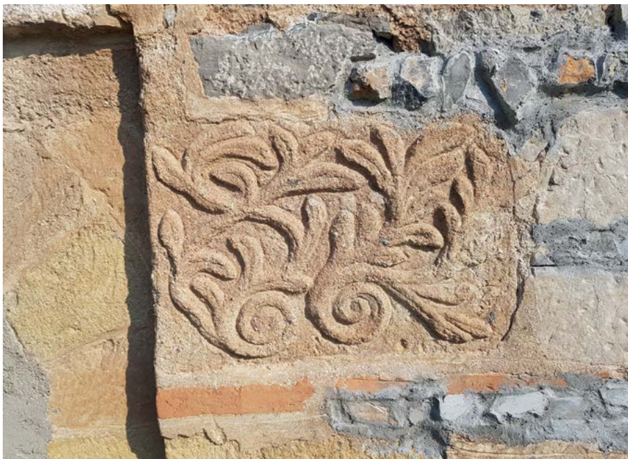
Фиг. 6. Храм „Св. архангел Михаил“ с. Студена, Пернишко. Релеф с растителни орнаменти.

На южната стена има три правоъгълни прозореца, вписани в рамки, завършващи в горния край с арки. Майсторите строители са украсили фасадата на южната страна с вградени пет кръста, направени от тухли. Интересни са трите малки трапецовидни релефа, вградени в самата арка (ниша) на южната врата. Централният релеф представлява издълбан кръст. Релефът от дясно на централния е зает от птица с разперени крила и раздвоена опашка. В левия релеф са изобразени слънцето и луната с човешки лица и малки крила. От двете страни на южната зазидана врата и патронната арка са вградени каменни релефи: ламя, женски колан с пафти, двуглава птица, растителни мотиви.