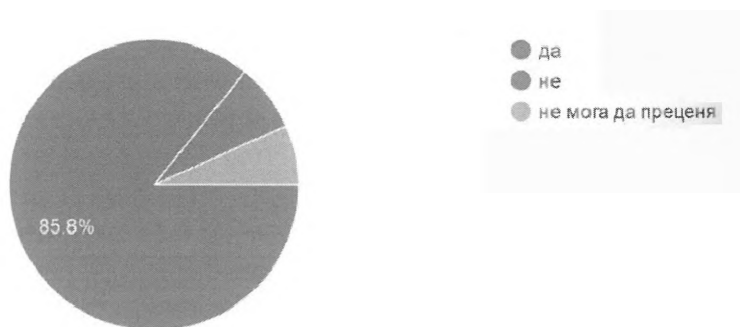
Фиг. 3. Изследване на предварителното проучване на дестинации.