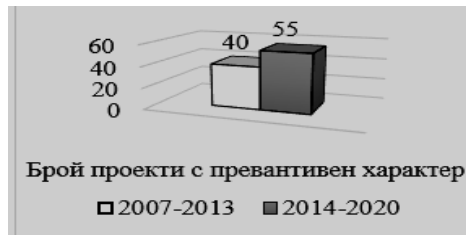
Диаграма 1. Сравнителен анализ по К1 бр.проекти [3;11]

На диаграма 2 се вижда развитието на ТГС между България и Румъния, сравнявайки ги по К2 бюджет проекти . Отчита се ръст от 34% на общия бюджет на трансграничните инициативи, договорени за реализиране през последния програмен период, както и на стойността на средствата, усвоени от ЕФРР.