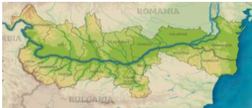
Фиг. 1 Карта на българо-румънския трансграничен регион за 2014-2020 г. [4]

За програмния период 2014-2020 г. в българо-румънското ТГС се включват партньори от осем български области (Видин, Враца, Монтана, Плевен, Велико Търново, Русе, Силистра, Добрич) [3] и седем румънски окръга (Мехединци, Долж, Олт, Телеорман, Гюргево, Кълъраш, Констанца) (виж фиг. 1). Общият бюджет на трансграничната програма е 258,5 млн. евро, от които 215,7 млн. евро се предоставят Европейския фонд за регионално развитие (ЕФРР). Към м. май 2019 г., от подадени 855 проектни предложения, са договорени 164 проекта на обща стойност 254,2 млн. евро или над 98% възможна усвояемост. От тях 105 са в процес на изпълнение (207,6 млн. евро), 58 (45,3 млн. евро) са приключили, а един е прекратен поради финансова нестабилност на част от партньорите [4].