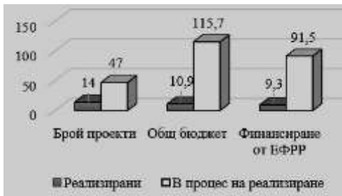
Диаграма 3. Брой проекти с бюджета им (в млн. евро), финализирани до 2018 г. и в процес на реализиране до 2023 г. [2]

Следващата задача е да се обобщат очакваните резултати и ползи от договорените трансгранични проекти, които предстоят да бъдат реализирани до 2023 г. 77% от трансграничните проекти за периода 2014-2020 г. са в процес на реализиране. Тяхната стойност представлява 93% от общия бюджет и 91% от средствата, предоставени от ЕФРР, за осъществяването на всички 61 проекта, допринасящи за по-сигурна и по-стабилна икономическа среда.