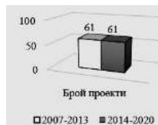
Диаграма 1. Сравнителен анализ по K1 бр.проекти [2;5]

Резултатите от събраните и обработени данни от двата програмни периода по отношение на броя проекти, които имат благоприятно влияние върху икономическата сигурност, са представени на диаграма 1. Тенденцията, която се очертава, е стабилност по отношение на първия критерий.