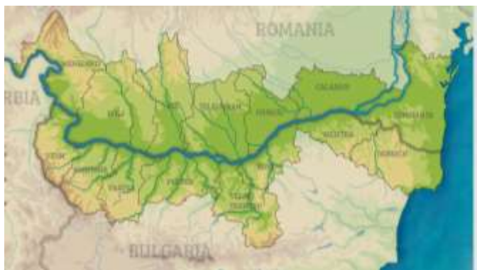
Фиг. 1 Карта на българо-румънския трансграничен регион за 2014-2020 г. [2]

За програмния период 2014-2020 г. в българо-румънското ТГС се включват партньори от осем български области (Видин, Враца, Монтана, Плевен, Велико Търново, Русе, Силистра, Добрич) [1] и седем румънски окръга (Мехединци, Долж, Олт, Телсорман, Гюргево, Кълъраш, Констанца) (виж фиг. 1). Общият бюджет на трансграничната програма е 258,5 млн. евро, от които 215,7 млн. евро се предоставят Европейския фонд за регионално развитие (ЕФРР). Към м. ноември 2018 г., от подадени 855 проектни предложения, са договорени 153 проекта на обща стойност 225,8 млн. евро или над 87% възможна усвояемост. [2].